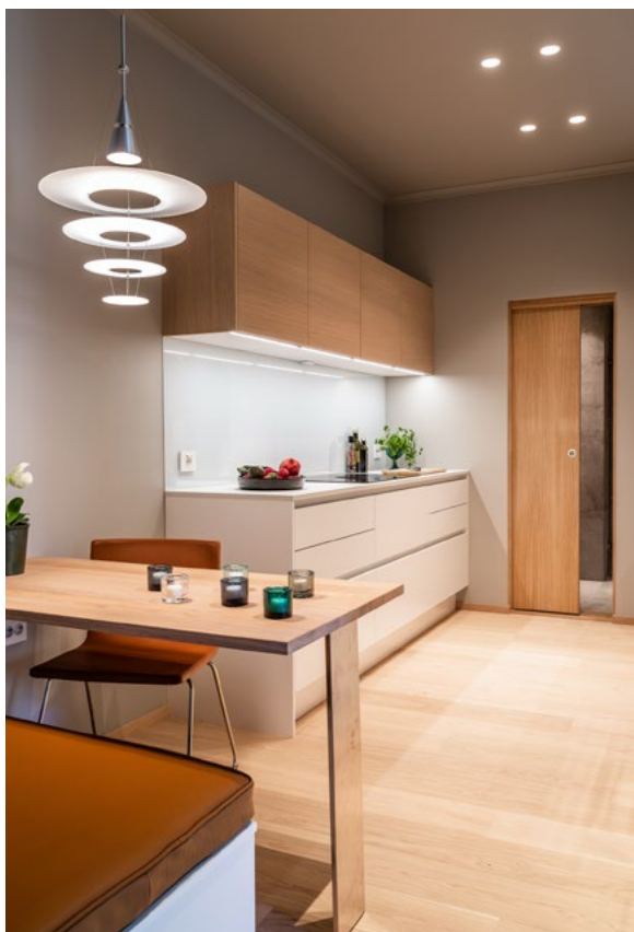
Behagelig belysning har også vært i fokus for å skape gode rom å være i.