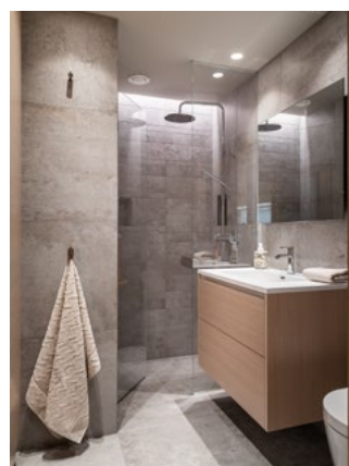
Bad med egen vaskesone.