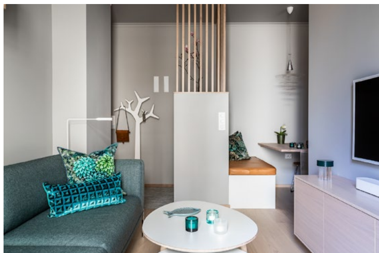
Leiligheten fremstår nå som gjennomtenkt og gjennomført, uten halvveisløsninger.