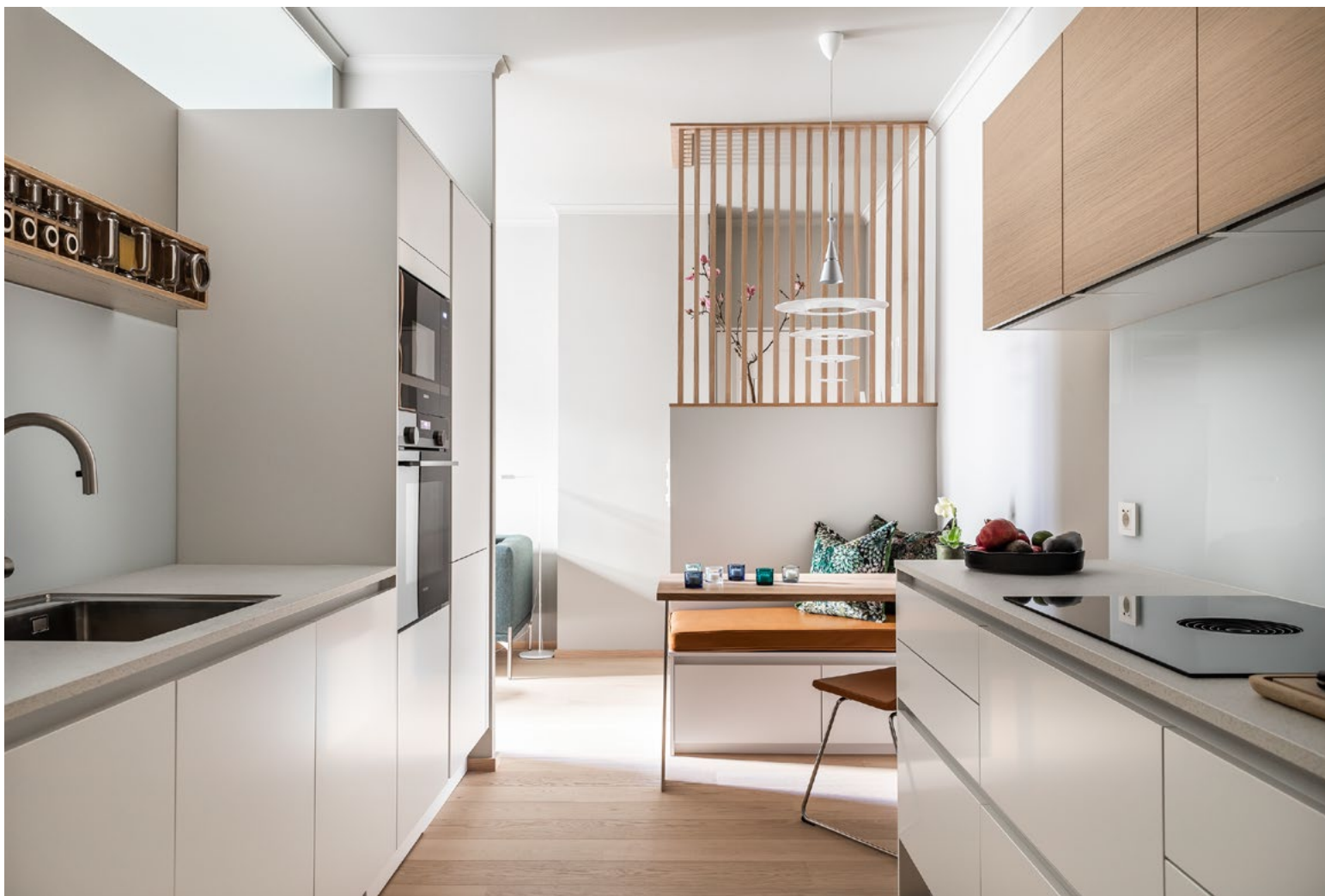
Kjøkkenet med god benkeplass, skaplass og spiseplass.