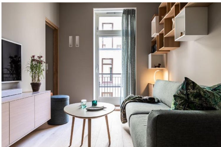
De faste innredningene er holdt i nøytrale toner som er varige over tid, så kan heller det velges andre farger på vegger, himling og møblering.