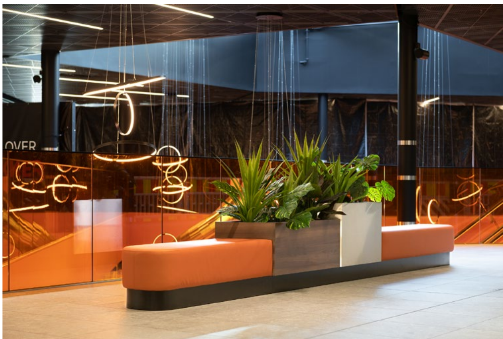
Sittebenkenes stramme linjer gjenspeiler arkitekturen, og tekstilene er holdt i den enkelte soners farge.