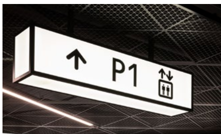
Godt synlige lysskilt gjør det enkelt å orientere seg på store sentret.