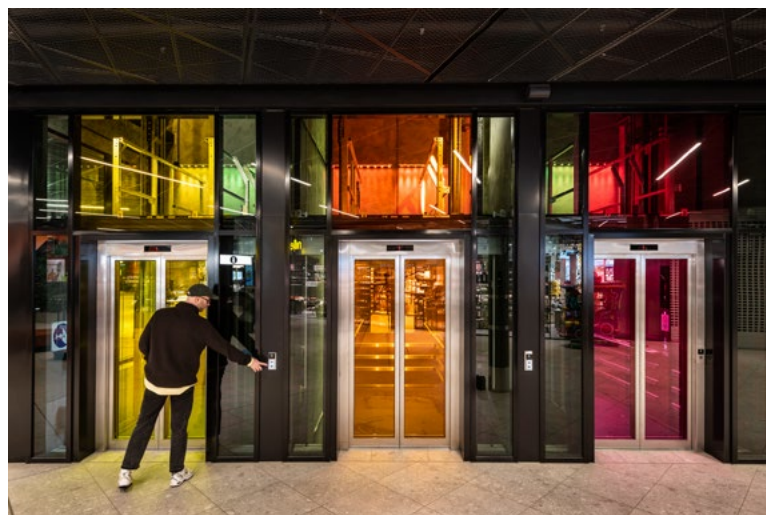
Sentrets tre signalfarger, er samlet i den store glassheisen. Det gjør den til et visuelt blikkfang/fokalt punkt.

I den nyeste delen av sentret er det nivåforskjell, og her ble det spesialdesignet sittebenker med integrerte plantekasser som et alternativ til rekkverk i glass eller andre blokkerende elementer. Dette forenkler renholdet og legger til rette for naturlig navigasjon gjennom og forbi nivåforskjellene.