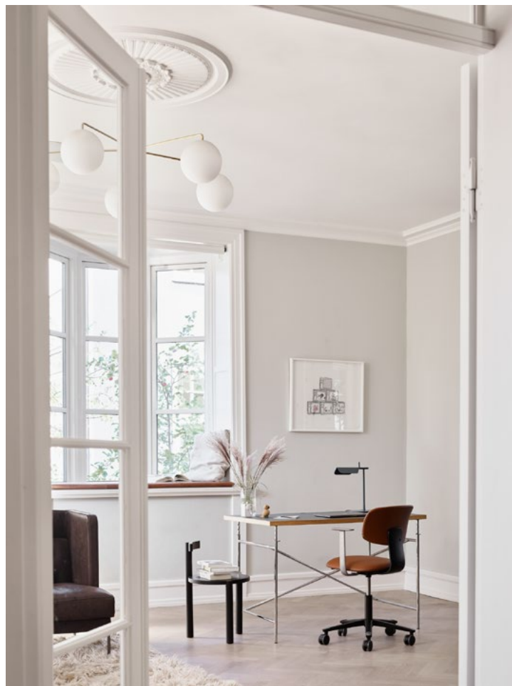
Tion skal være et naturlig valg også for hjemmekontoret.