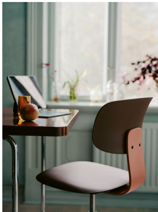
Standardmodellen har plastsete og rygg, men har i den underliggende bevegelsesmekanismen innebygget tilstrekkelig komfort for lengre sitting.