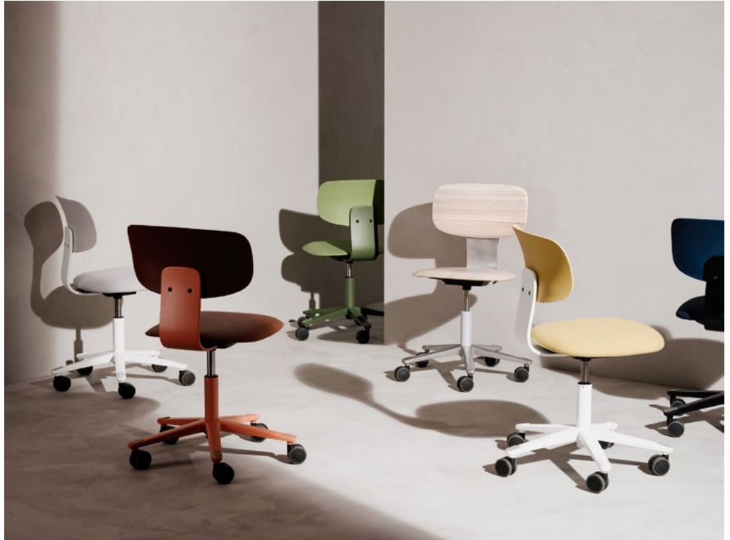
Tion lar seg kle opp i utallige konfigurasjoner tilpasset sine omgivelser og formål. Farger, tekstiler og ulike materialer gir tilnærmet uendelig variasjon.