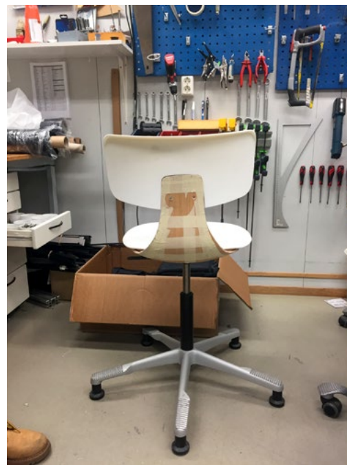
En av mange fullskalamodeller som ble bygd underveis i workshopene. Her i papp og med 3D-printet rygg og sete satt på et tradisjonelt understell.