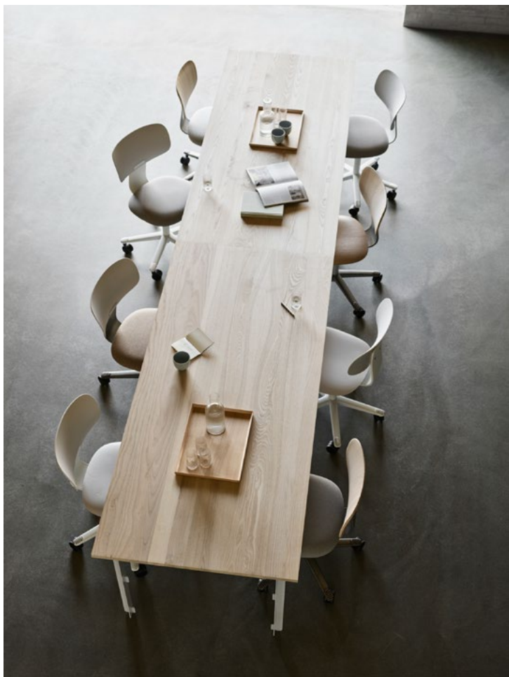
Konferansestol, kantine stol eller til arbeidsfellesskapet; Tion er ment å passe inn de fleste steder der man ønsker å gruppere med flere stoler.