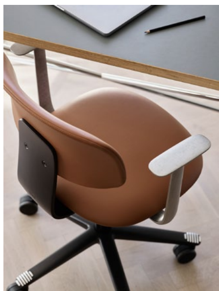
Tion kontorstol har støpte armlener i aluminium som tilvalg. Som ryggfestet kommer disse i ulike overflater og farger.