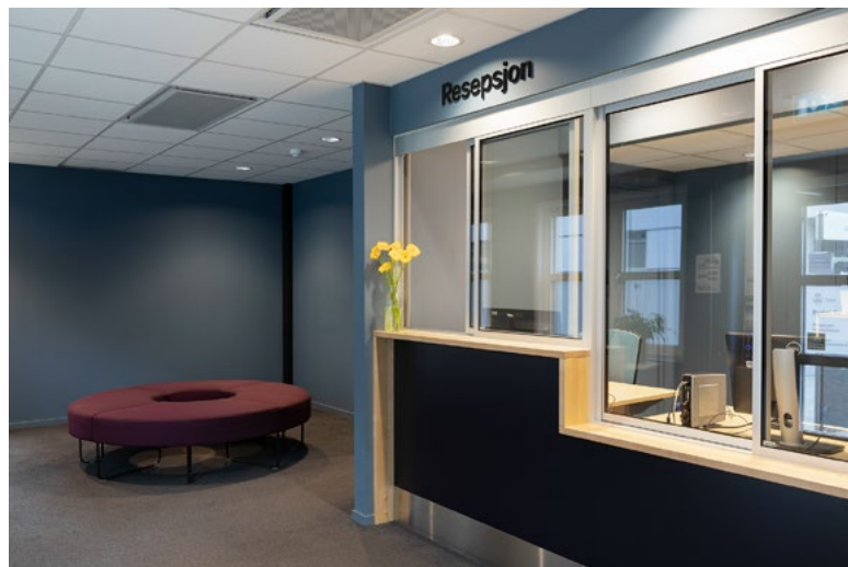
En ny fellesresepsjon for hele bydelen ble etablert med ønske om å ta imot brukere på en tydelig og hyggelig måte. Resepsjonen skulle ha et imøtekommende og åpent uttrykk og være UU. Samtidig var det viktig å ivareta de ansattes sikkerhet, derav glass.