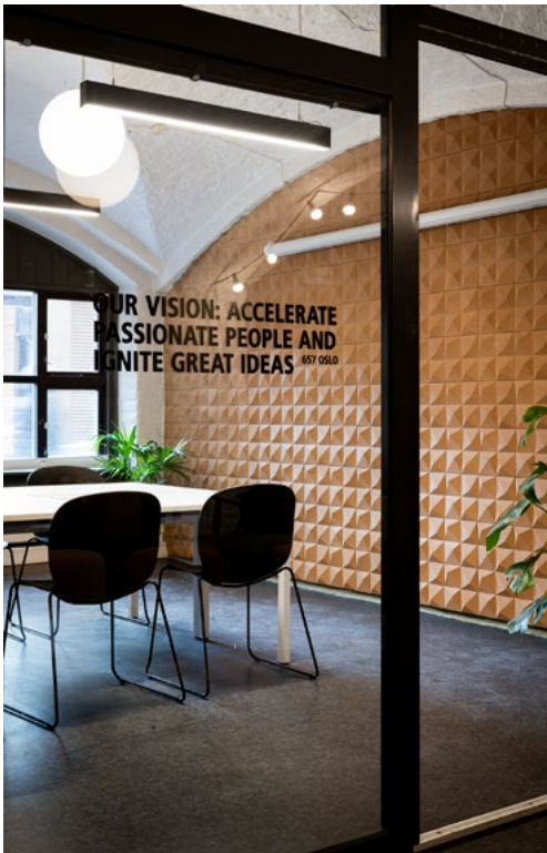
Korkvegg løser utfordrende akustikk og fremhever takhvelving.