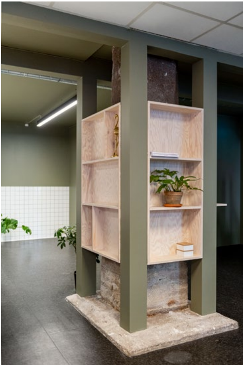
Plassbygget hylle skjuler føringer som gjør at søyle ikke kunne avdekkes helt.