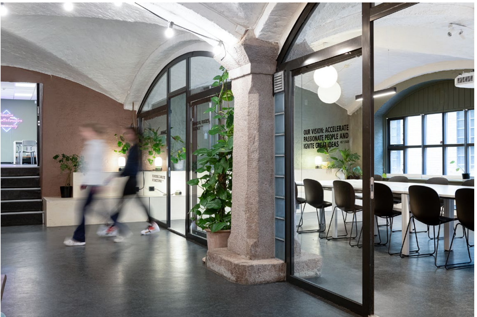
Fargesetting og belysning fremhever markante steinsøyler og hvelvinger i taket.