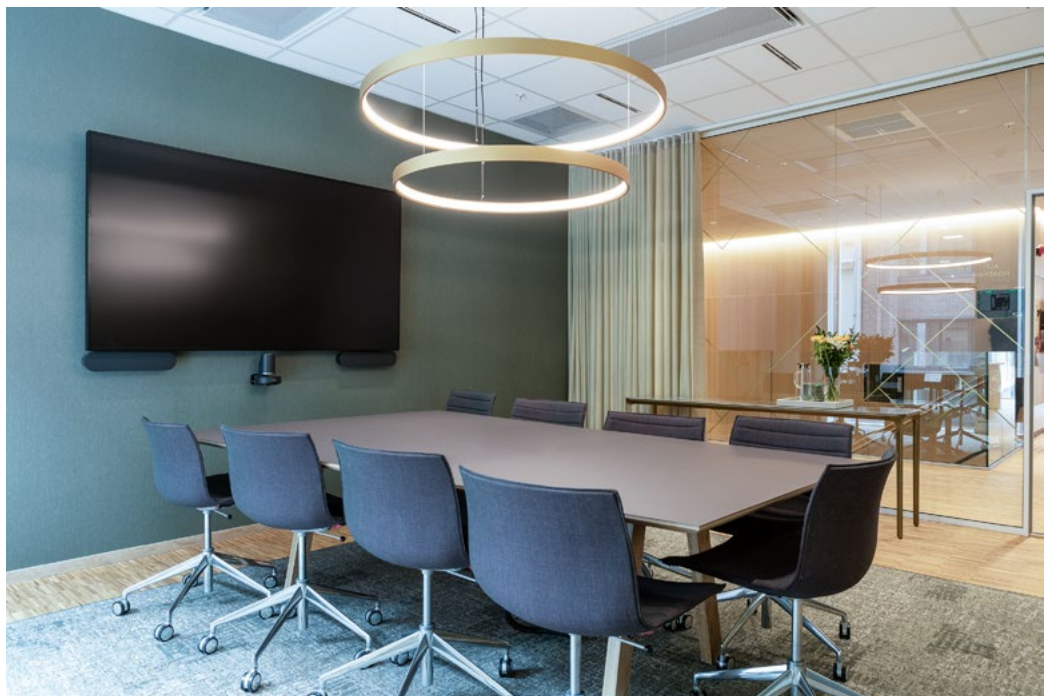
De romslige møterommene tilknyttet Torget er gitt et eksklusivt preg med tekstiltapeter, gardiner, tepper og messingarmaturer. Her vises den skrå folien i glassfronten i messing – inspirert av bibliotekshyllen.

ut mot fortauet. Til biblioteksdelen ble det designet et stort dråpeformet bord som gir rom for mange drop in-plasser. Alle møblene har en organisk form, som spiller videre på de buede avslutningene i bygget og som gjør det enkelt å bevege seg rundt i rommet. Stolene på Torget er besøksstolene som stod inne på hvert kontor i de gamle lokalene. Kaffebaren med en avrundet øy utgjør et naturlig samlingspunkt for prat blant de ansatte. To store møterom er plassert i direkte tilknytning til Torget og kan