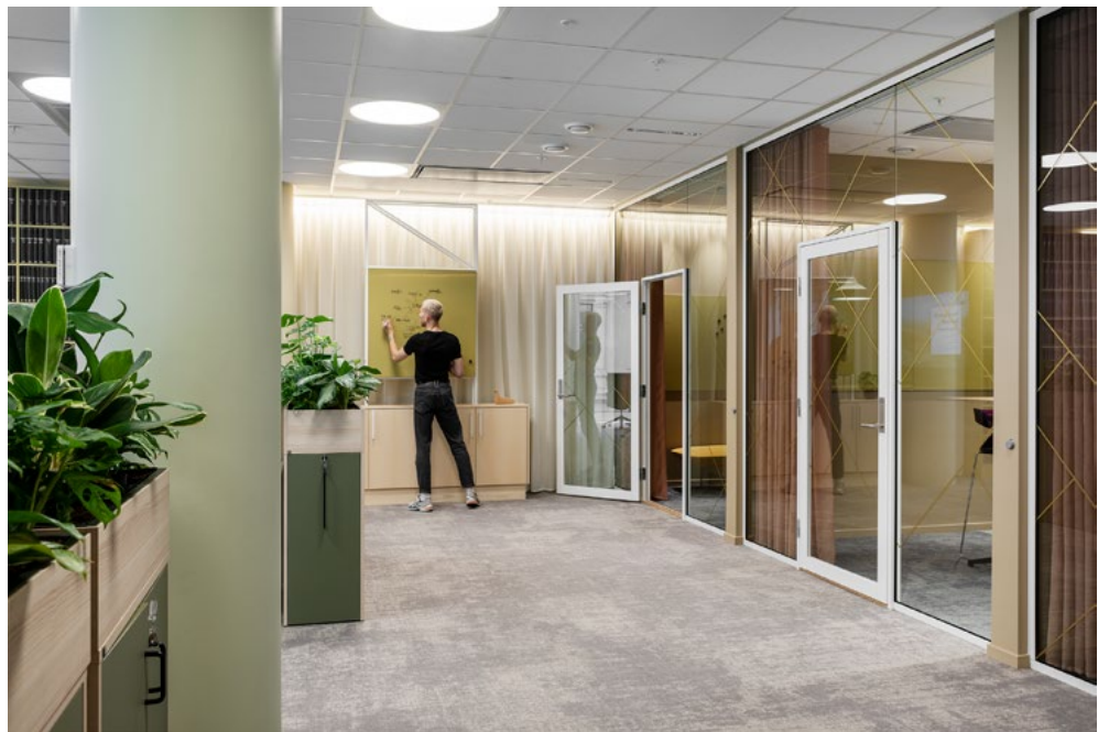
Den lange bakveggen i enden av lokalet. Her er det tekstiler, oppbevaring, akustikkelementer og bokhyller – et behagelig multifunksjonelt blikkfang i kontordelen.