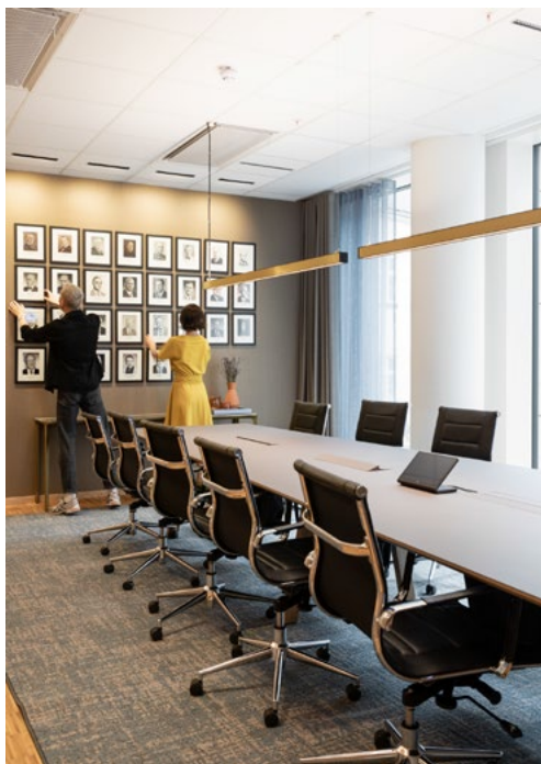
På styrerommet henger alle advokatforeningens generalsekretærer. Stolene er gjenbruksmøbler fra det forrige kontoret. Rommet har fått tekstiltapeter, og doble gardiner for et mer eksklusivt «hotellpreg».