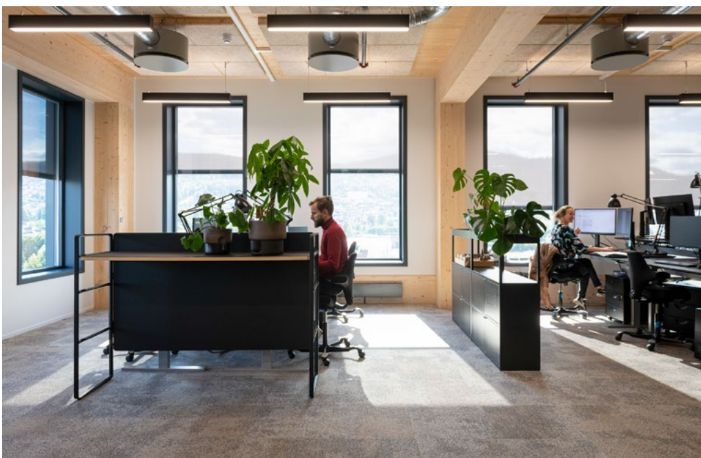
Drammenskontoret til Dark Arkitekter, byggets arkitekt, holder til i Spor X.