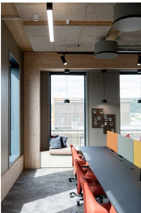
Plassbygde sittenisjer i vinduet hos en leietaker setter fokus på utsikten.