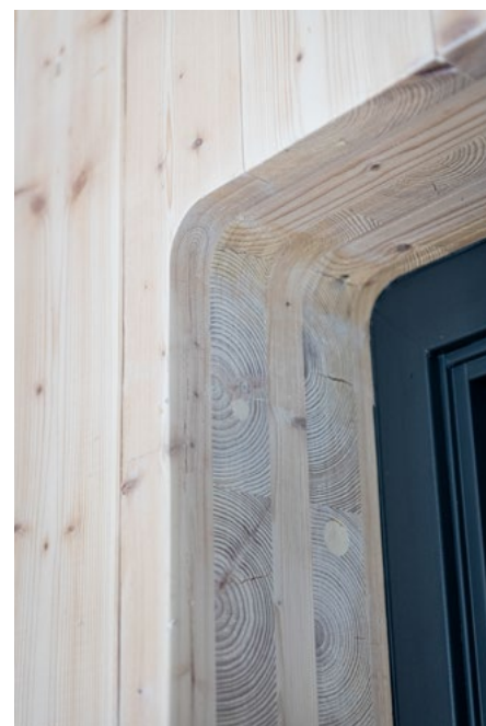
I kjernen står konstruksjonen frem med vakre detaljer.

materialvalg for alle innvendige elementer. De karakteristiske elementene i tre danner en grunnpalett av eksponert tre med lypigmentert olje. Glassveggene er festet mot trebjelkene slik at disse enkelt kan demonteres for fleksibel bruk. I kontorarealene er det tepper i resirkulerbart garn. På toalettene benyttes linoleum fremfor fliser, som ikke er sirkulært, og må sendes til deponi. Akustikk ivaretas med treullsement montert direkte i den eksponerte himlingen.