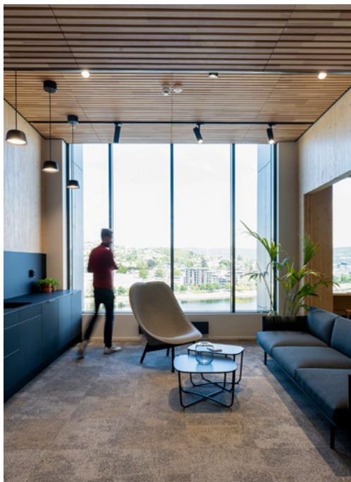
Sosiale soner med stor takhøyde og store vinduer gir god utsikt over Drammenselva.