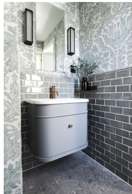
Toalett med klassisk tapet og innredning.

opprinnelige stil, var å utforme styre- og møterommene som stuer. I stedet for en kantine tegnet de et stort og hjemmekoselig kjøkken som hovedsamlingspunkt. Toalettene har blitt små unike smykker i de ulike etasjene. De er utstyrt med tradisjonell innredning i klassisk engelsk stil, og alle har en kombinasjon av keramiske fliser og tapet.