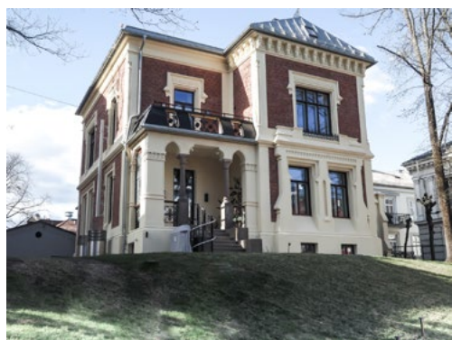
Et lite slott på Frogner.