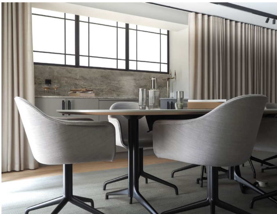
Blant grepene som er gjort for å styrke hjemmefølelsen og bevare husets opprinnelige stil, var å utforme møterommene som stuer.