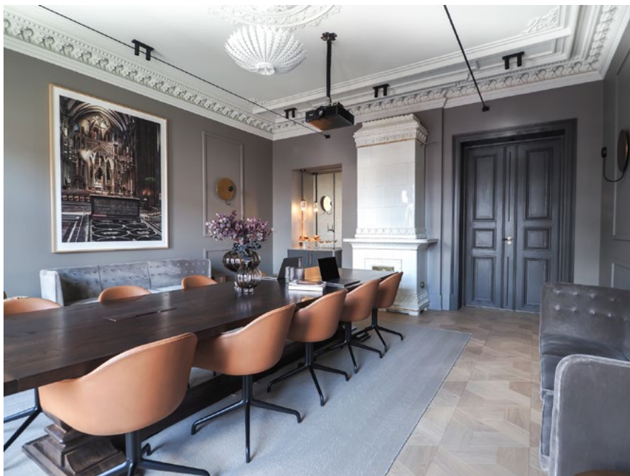
Himling og kakkellovn er tatt vare på og rehabilitert.