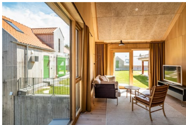
Interiør fra en av rorbuene på tunet.

skifer og betong. Materialer som tåler en støyt. Utstrakt bruk av tre balanserer det maskuline i stål og skinn og gir en nordisk klang.