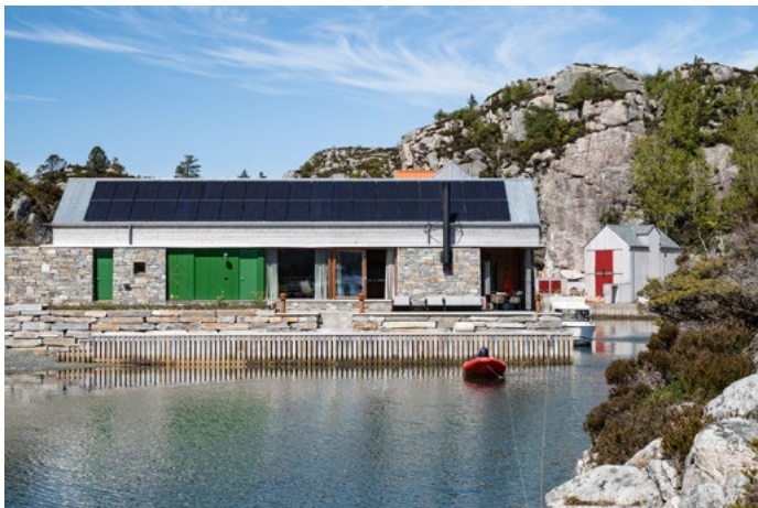
En klassisk naustpalett basert på oker, grønn og vestlandsrød går som en tråd gjennom hele miljøet.