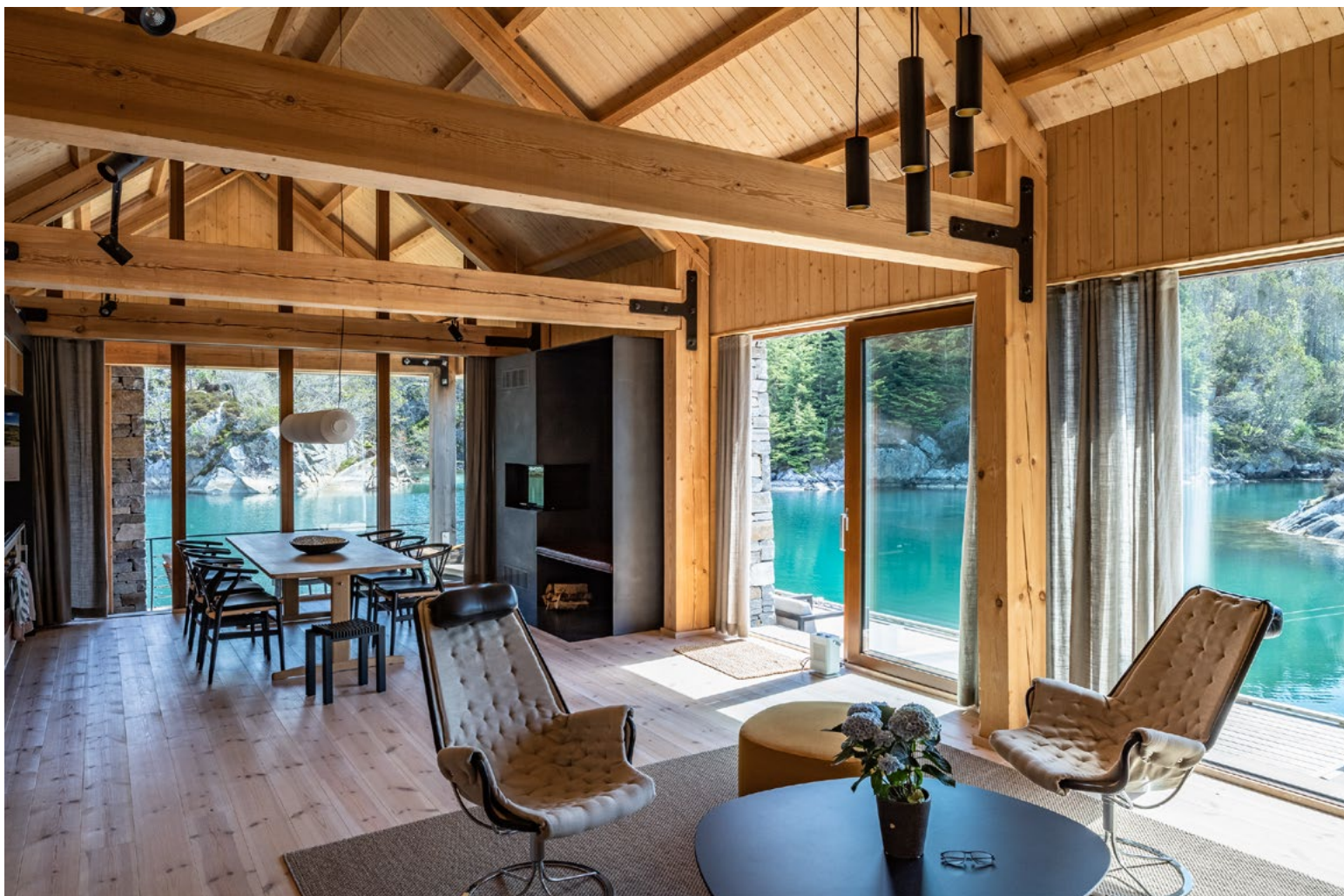
Allrommet og den nære natur. Fra overnattingsbu.