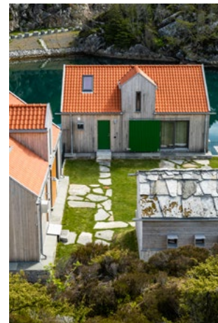
Personlighet og sjarme, forankret i lokal byggeskikk.