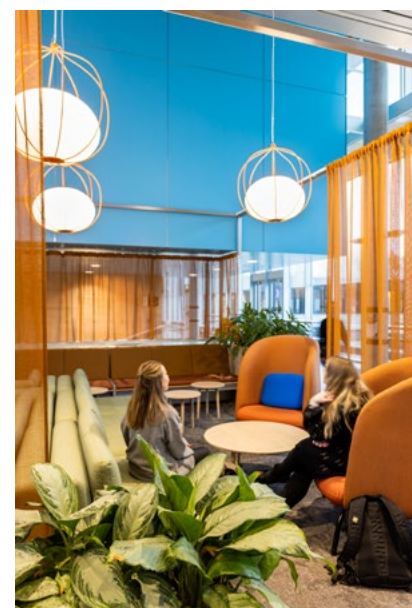
Nedsenket belysning fra den svært romslige takhøyden skaper rom i rommet.