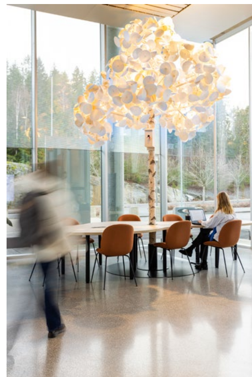
Leaf Lamp fra Green Furniture Concept lyser opp resepsjonsområdet.

De nye vranglearealene er i dag med på å synliggjøre aktiviteten som foregår på campus. Små varme lommer som er plassert langs aksene inviterer inn til individuelt og felles studiearbeid, til uformell læring og sosiale samhandlinger, og som et mål i campusutviklingsplanen; oppmuntrer til faglig og sosialt miljø, også etter skoletid. Et økosystem for læring.