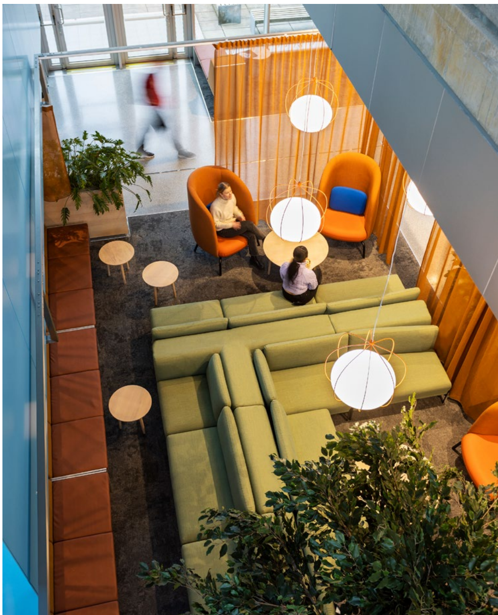
Løse gardiner som omkranser den store loungen har gitt studentene mulighet til å skape egne private rom, tilbaketrukket fra den trafikkerte hovedgaten.

var av stor betydning. Eksisterende benker er i dag redesignet og sees i nye situasjoner. Finerbenkene til 3 personer, med sitteputer i grått ullstoff er redesignet til sjeselonger. De skisserte ut ny løsning hvor en sidevange er skiftet ut med en ny i dobbelt høyde. En eksisterende sittepute er erstattet med en større plassformet lenepute sydd i gyllent ullstoff, hvorav resterende sitteputer er trukket om i Silvertex for slitestyrke og renhold, da sko og føtter plasseres her. Et hev/senk sving-bord er montert til underbenken for fleksibilitet av arbeidsplass, og setter rammene for sjeselongens funksjonalitet og design.