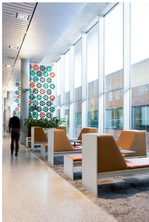
Redesignet sittebenker sees i ny drakt – sjeselong for uformelt studiearbeid. Fra himling er det montert hengende veggabsorbenter fra Abstracta. Et romlig element for bedre oppdeling av korridoren.