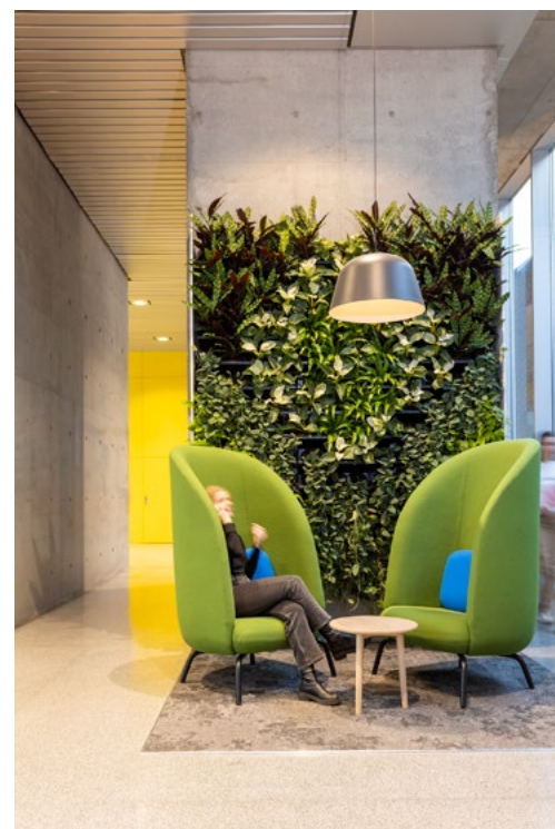
Med utgangspunkt i den eksisterende arkitekturen bestående av stramme kubiske betongelementer og innslag av kulørrike veggpaneler, har de arbeidet frem en fargepalett som mykner opp arkitekturen og som samtidig gir liv til den ellers tomme, langstrakte korridoren.