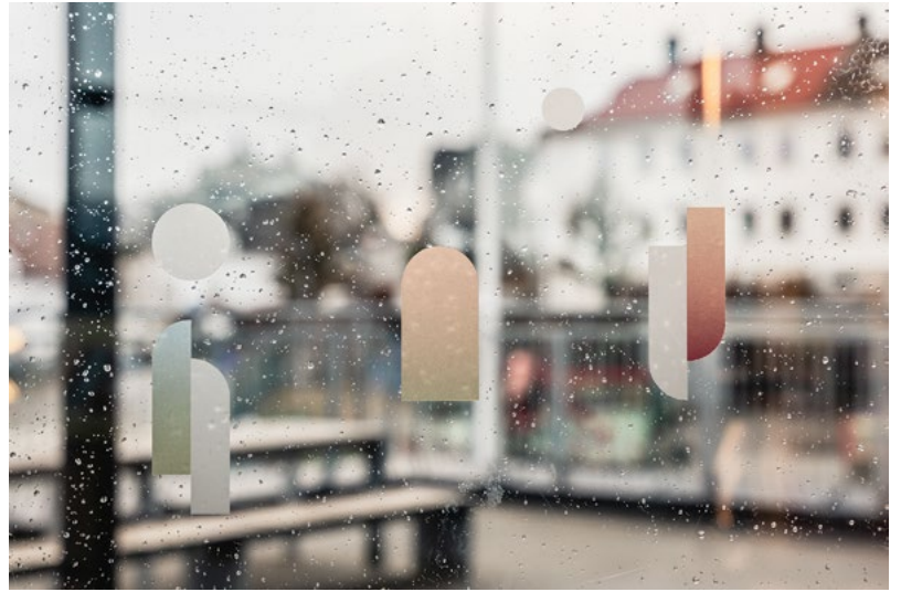
Sikkerhetsfolien er en del av identiteten som Haltenbanken har utviklet for prosjektet. Gradering av farger skaper et mykere uttrykk og kobler seg på kulører som man finner i omgivelsene.