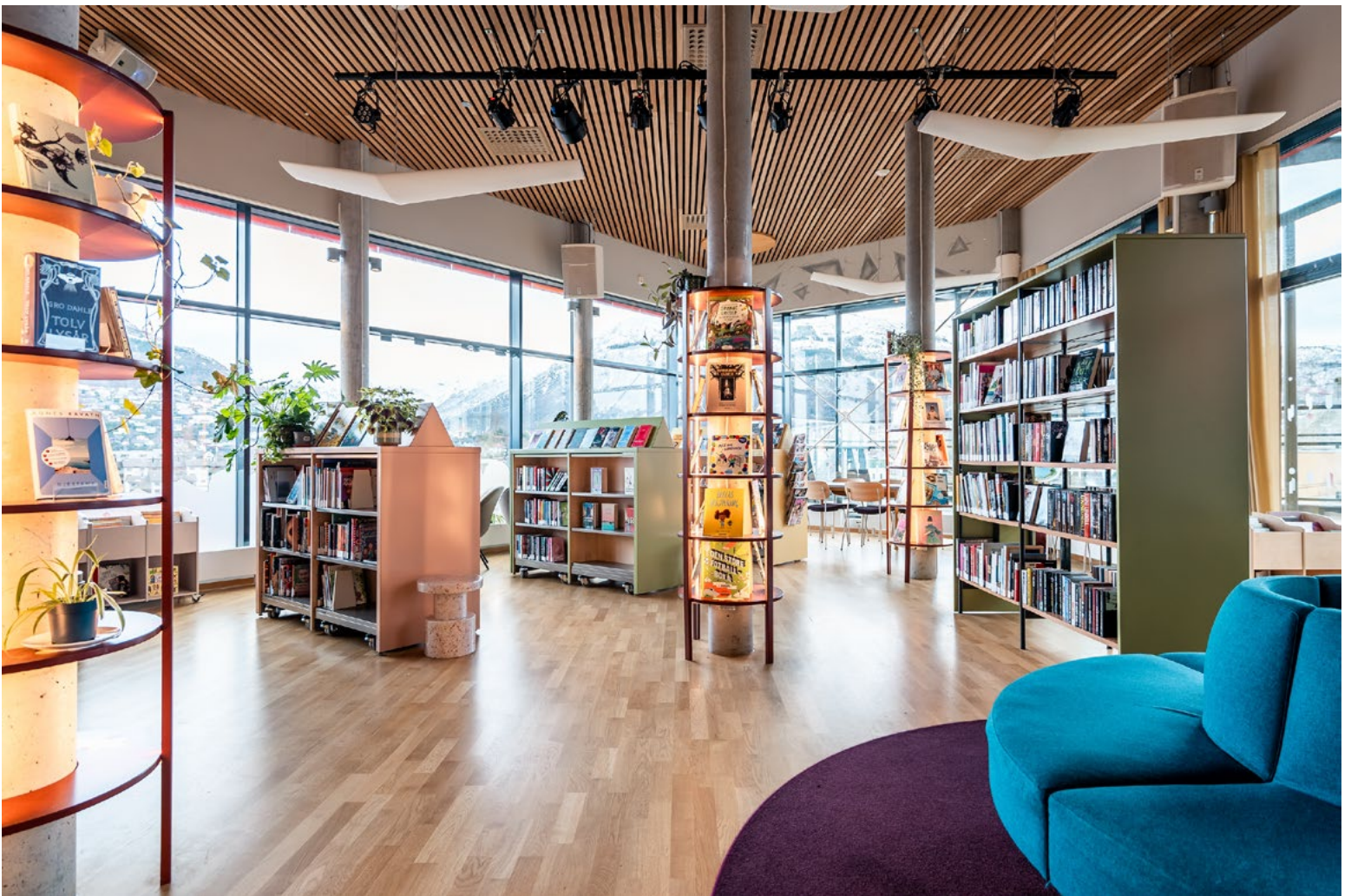
Biblioteket sett fra inngang. Biblioteket var opptatt av å ivareta utsikten mot byfjellene innover i rommet.