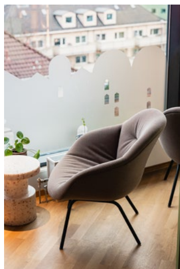
Krakker og loungestoler er nye møbler som ble tilført. Vindusfolie på fasade mot nord-øst er utviklet i tråd med identiteten. Funksjonen er å skjerme boliger nedenfor fra innsyn.