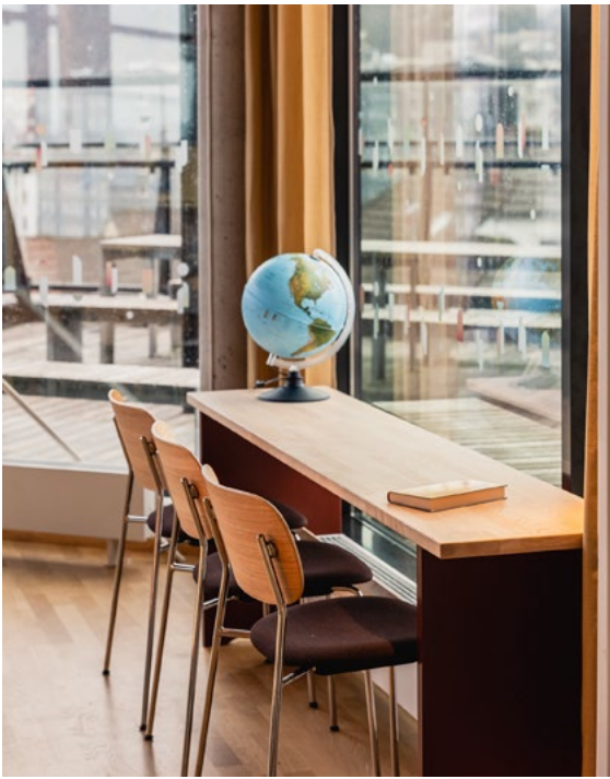
Bord i vinduer bidrar til variasjon for opphold, skaper kontakt med utearealet og inviterer inn. Bordplate i ask, ben fargesatt i tråd med fargepaletten og sarg som avstiver konstruksjonen og skåner radiator for slag fra føtter og stolben.