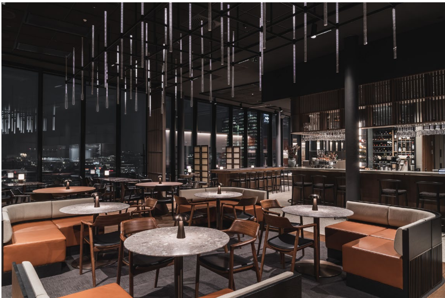
Balanse mellom det klassiske og ekspressive, dannet utgangspunktet for innredningen. Den store lysinstallasjonen, designet av Radius design, er både stillestående og bevegelig med lysbølger som sendes gjennom mange lysstoffrør.

Løs møblering med kafeoppsett, langbord og sittebåser gir mange ulike måter å sitte sammen på; flere rundt et stort bord, en samtale for to eller et raskt måltid alene. Et trappeamfi med praktisk oppbevaring under for serveringstraller osv., fungerer fint som romdeler mellom kjøkkenet og baren for kaffe og drikkevarer. Skjermet, og helt i front av arealene, ligger selve restaurantrommet med den helt unike utsikten fra Lodalen via Hovedøya til Kolsåstoppen og Tryvannstårnet. Oppdragsgiver ønsket en svært fleksibel møbleringsplan i restauranten, med sofamoduler i spisehøyde som raskt kunne flyttes for arrangementer og ulike oppdekninger. Det tilstøtende, permanente