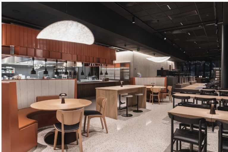
En stor, åpen kjøkkenløsning, der matlaging foregår i direkte dialog med gjestene, fungerer også som serveringsdisk ved lunsjtider.