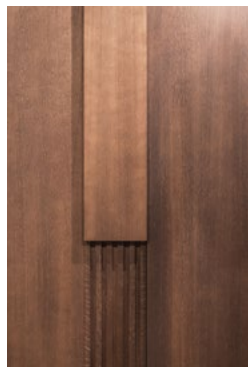
Radius design har utformet et stort antall plassbygde møbler.