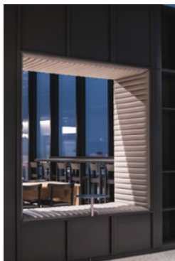
Restaurantrommet har den helt unike utsikten fra Lodalen via Hovedøya til Kolsåstoppen og Tryvannstårnet.