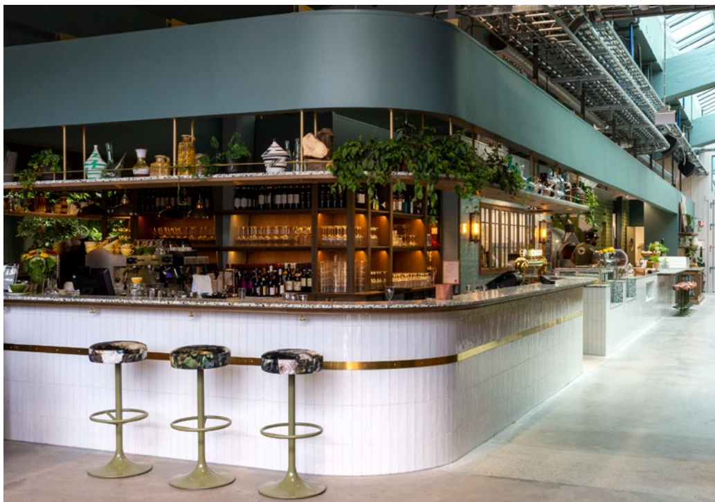
Baren er det første som møter deg: Velkommen skal du være!