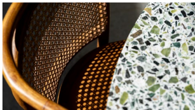
Spisebordene er gjenbruk fra den gamle fabrikk og er pusset ned og beiset på ny.