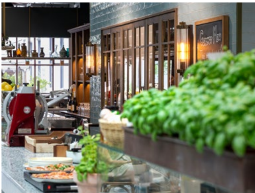
Serveringsdisken og baren er designet som en gate, med sprusser og belysning på veggene.