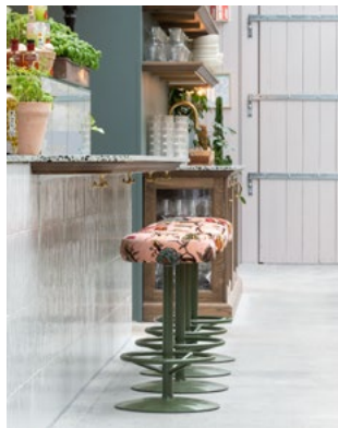
Alt er tegnet ut med inspirasjon fra sjarmende smau i Italia.