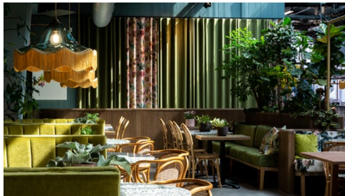
Overraskende og finurlige tekstilvalg.