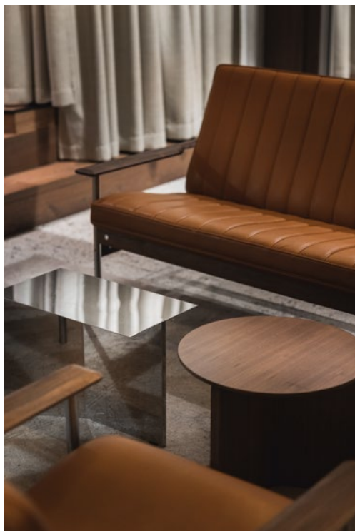
En møbleringsplan uten for mange dekorelementer, holder rommene nakne og rå som den opprinnelige arkitekturen.