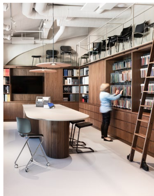
Materialbar er levert i samme materiale og finish som kjøkkenet. Mobil biblioteksstige gir tilgang til både materialer og stolutstilling i høyden.

Til prosjektet designet IARK flere innredningselementer for utstilling. Blant annet utformet de flere utstillingshyller til et stort antall stoler som står utstilt til enhver tid, og ville tatt mye plass om ikke det var for at de her kunne utnytte høyden optimalt.