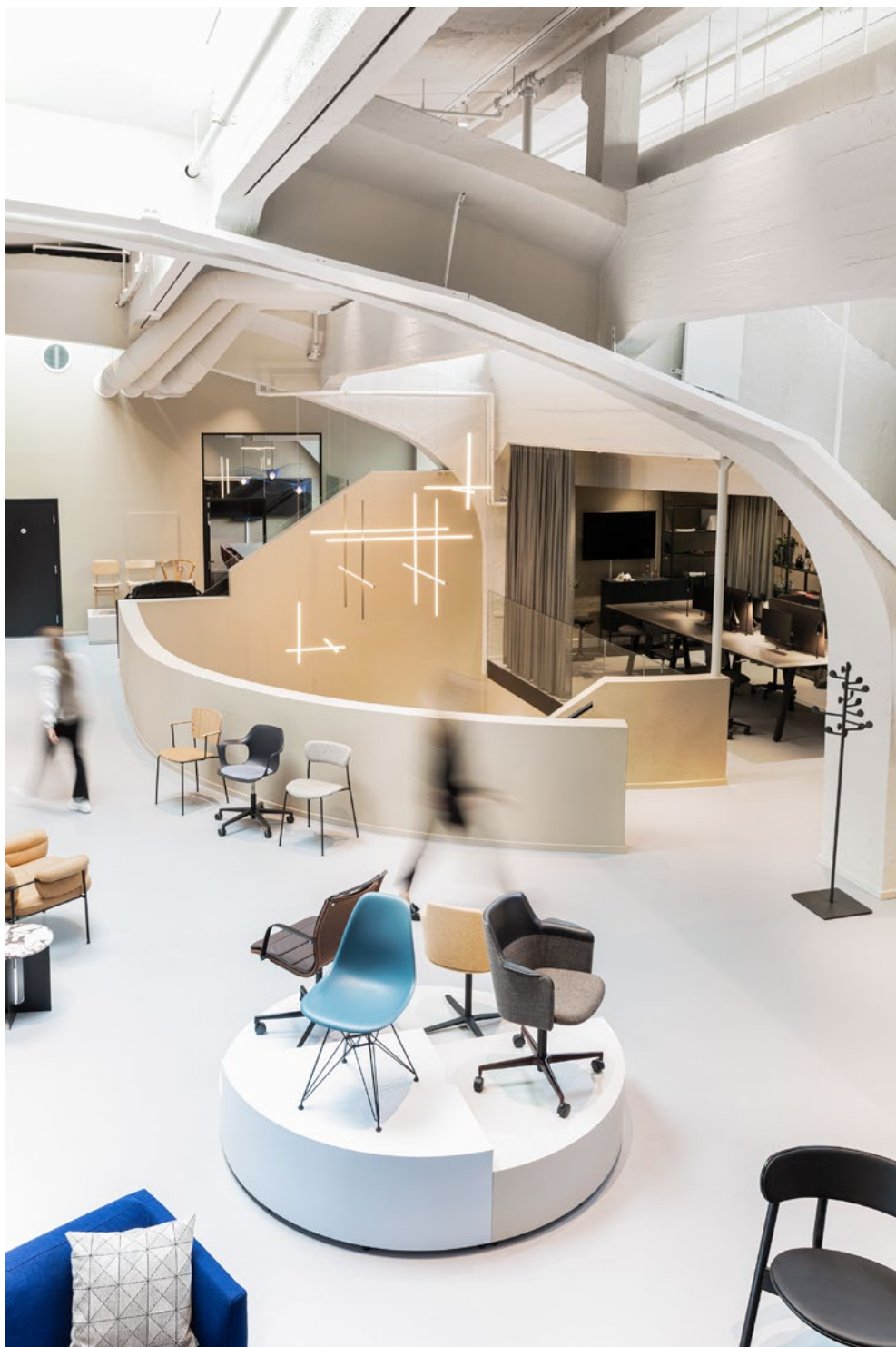
Byggets industrielle arkitektoniske karakter er fremhevet ved at bærende elementer som tak, bjelker og søyler er fargesatt i samme lyse fargetone som gir refleksjon til dagslyset.