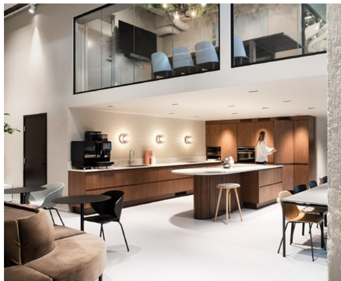
Kjøkkenet er trukket inn under mesanin der himlingshøyden er lavere enn i utstillingsarealet. Kjøkkenet og kjøkkenøy i valnøttfinner tilfører en varm tone til interiøret.