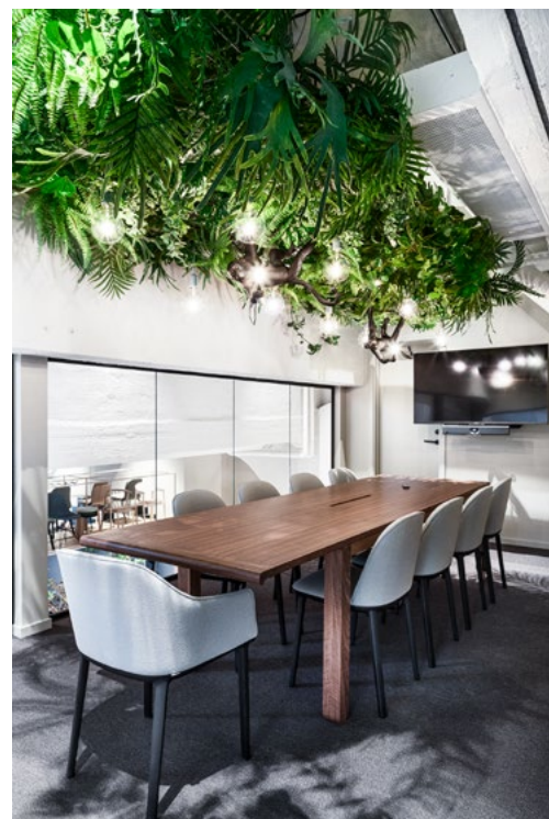
Hvert møterom har et eget uttrykk med lekne elementer

Materialbaren var spesielt viktig for kunden, da dette er en viktig del av prosessen med kunde og interiørarkitekt, og de ønsket å optimalisere måten materialbiblioteket blir brukt i møter. Rundt den store øya kan man jobbe, med god bordplass, og veldig tett på de ulike materialene man diskuterer. Slik forenkler design og romfunksjon det som før var mye løping inn og ut av møterom.