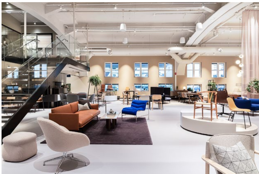
Stort fleksibelt utstillingsareal. Modulære utstillingspodier i ulike høyder, og som kan brukes på ulike måter, ble tegnet til prosjektet.