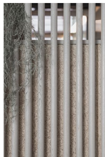
Spilevegg med lydabsorbenter i treullit.