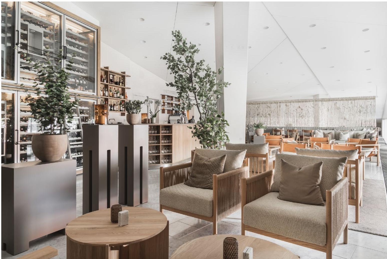
Det eksisterende vinskabet og anretning på langveggen i Corian og rustfritt stål, ble kledd inn med heltre eik i en varm brun tone.

ble det opprettholdt det mere klassiske restaurantoppsettet med mulighet for mer fleksibel møblering, samt toaletter.