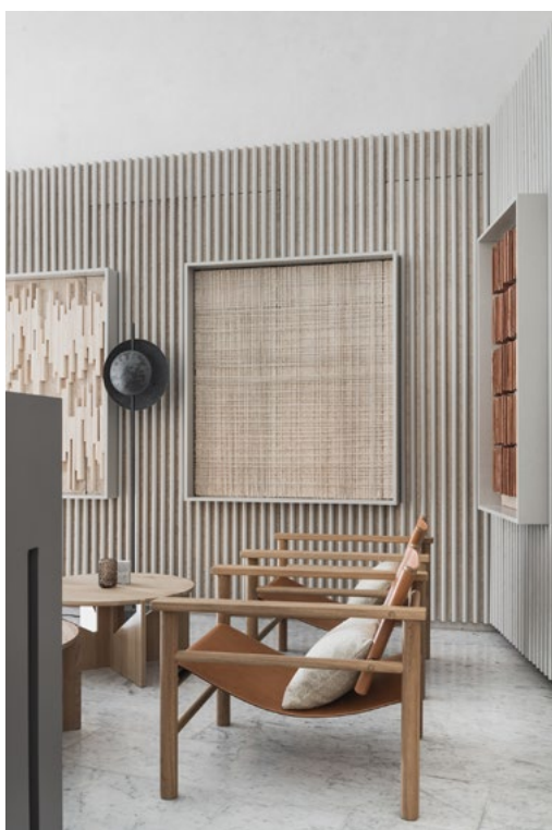
Spilevegg med lydabsorbenter i treullit, og spesiallagete dekorasjoner.