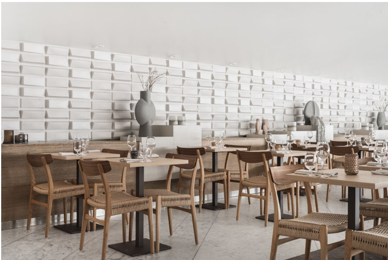
Restaurantdelen. Spesialdesignete veggfliser produsert av Porsgrund Porselen, ble beholdt, men malt med matt maling i myk hvitfarge.