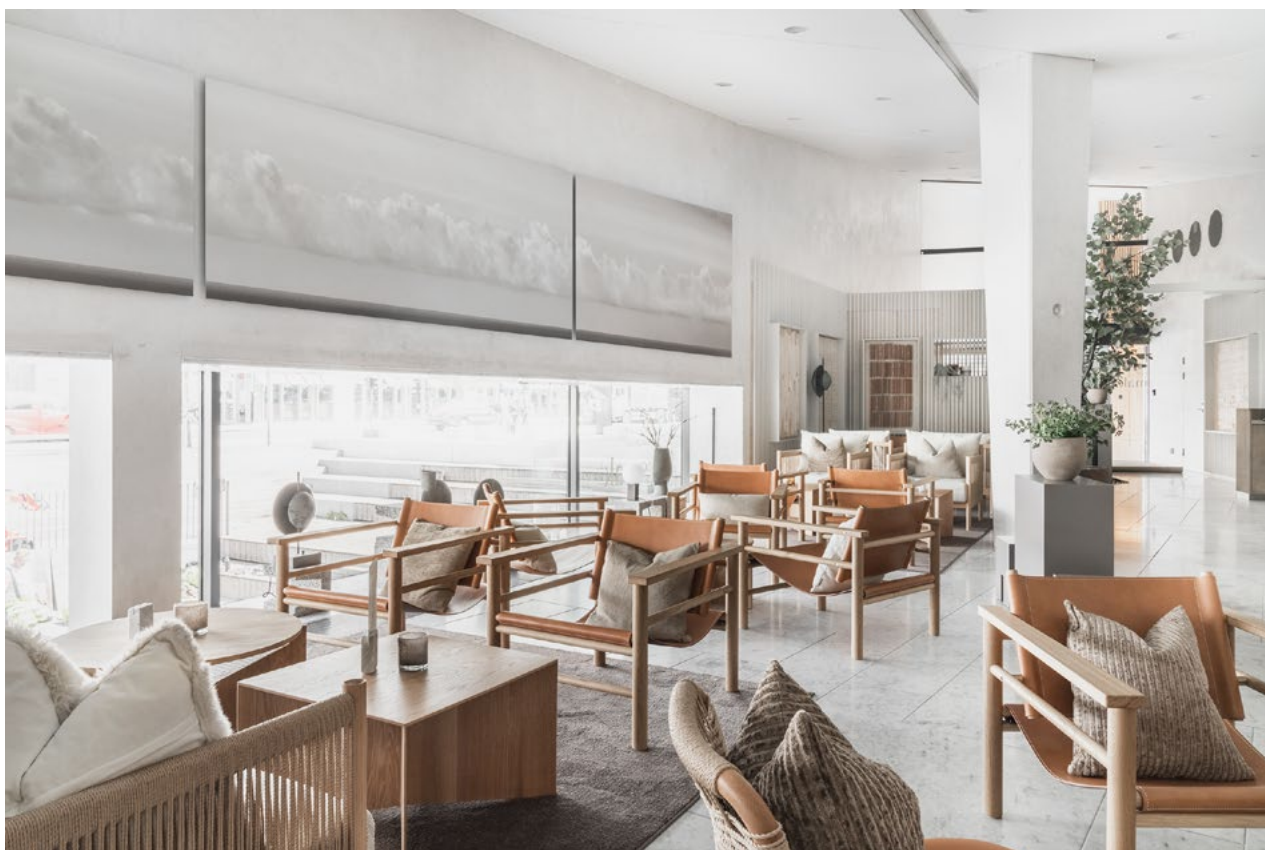
Loungeområdet. Møbler i oljet eik, lær og rotting. Nye soner ble etablert med små og større sittegrupper.