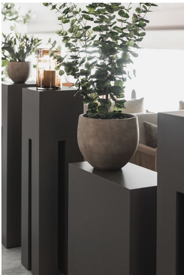
Spesialdesignete hyller, pedestaller og romdelere.