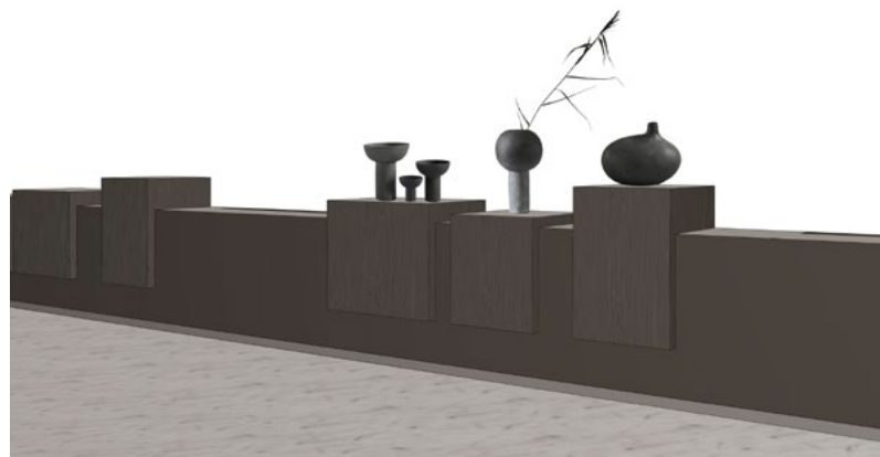
Skisse til hylle.