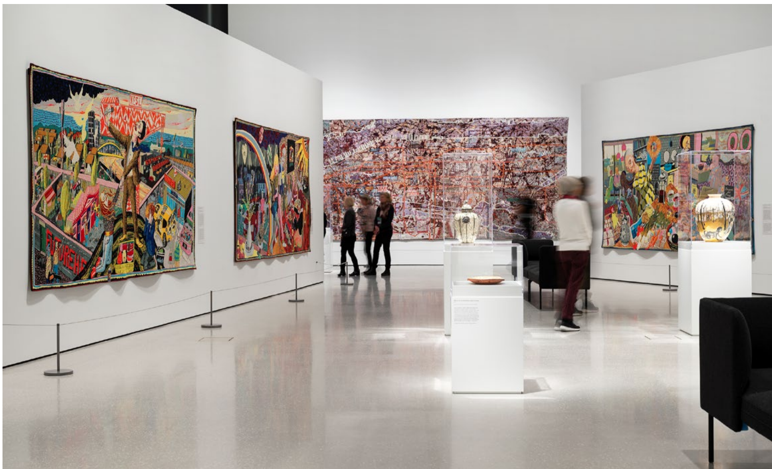
Veggene ble dimensjonert ut fra tiltrengt utstillingsflate og nøye plassert for å skape romlig inndeling for ulike temaer. For enden av salen ble det bygget en høy hvit vegg som speilet den faste vegg på motsatt side. Dette gjorde rommet lysere og understreket det galleriaktige preget, særlig sentralt i utstillingen.