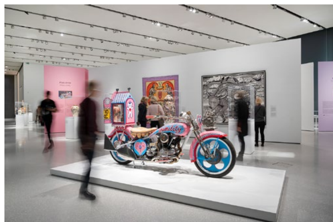
Målsatte plan og snitt anga nøyaktig plassering av verk og etiketter, både på vegg og i montre. Motorsykkelen Kenilworth AM1 var et overraskelsesmoment i det borte hjørnet av utstillingen.

rettet innover i salen for å skape et lyst, samlende rom i rommet. Museets bestilling var at arkitekturen skulle bidra til «å skape et enkelt og rent uttrykk som gir fokus til kunstverkene uten for mye opplevd designfiksakeri». Perry selv ønsket en utstilling med et galleriaktig preg. Store veggflater og frittstående montere ble dimensjonert spesifikt for verk med ulike uttrykk, materialitet og størrelse – fra monumentale bildevev til keramiske vaser.