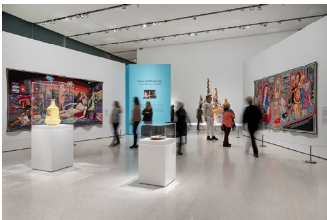
Grayson Perry deltok aktivt i fargesetting av tekstvegger. Introveggen fikk «a flesh colour, pale pinky orange», NCS S 1015-Y80R. Størrelse og plassering av tekst ble utformet i samarbeid med grafisk designer og utprøvd i fullskala.