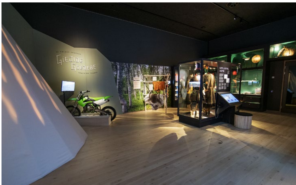
Rommet har lavvoen i sentrum, slik den også er i sentrum i sørsamenes liv. Rommet rundt har fjell og naturformer. Arkivvegg i enden, monter med koffer, interaktiv skjerm der man kan studere detaljer i koftene.