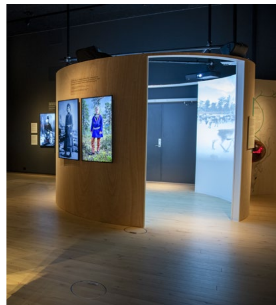
Nye og gamle portretter av personer som er i slekt henger side om side. Monter med eiendeler. De nye portrettene er levende bilder. Til høyre ser man det pulserende hjertet inni en klode (en del av opprinnelsemyten).