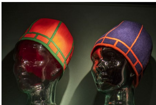
Utstillingen viser også sørsamenes levende håndverk.