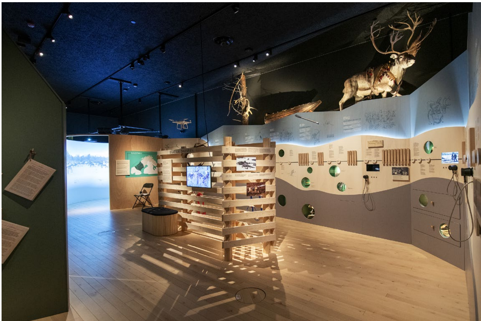
Tidslinjen ligger i flere nivå, med tittehull, lyd, film og objekter.