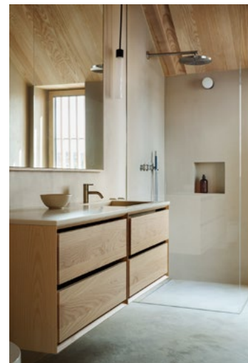
Bad i ask og mikrosement.

og bidro til å utvikle og å bygge den plassbygde innredningen.