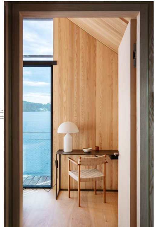
Husets andre etasje er kledd i ask.