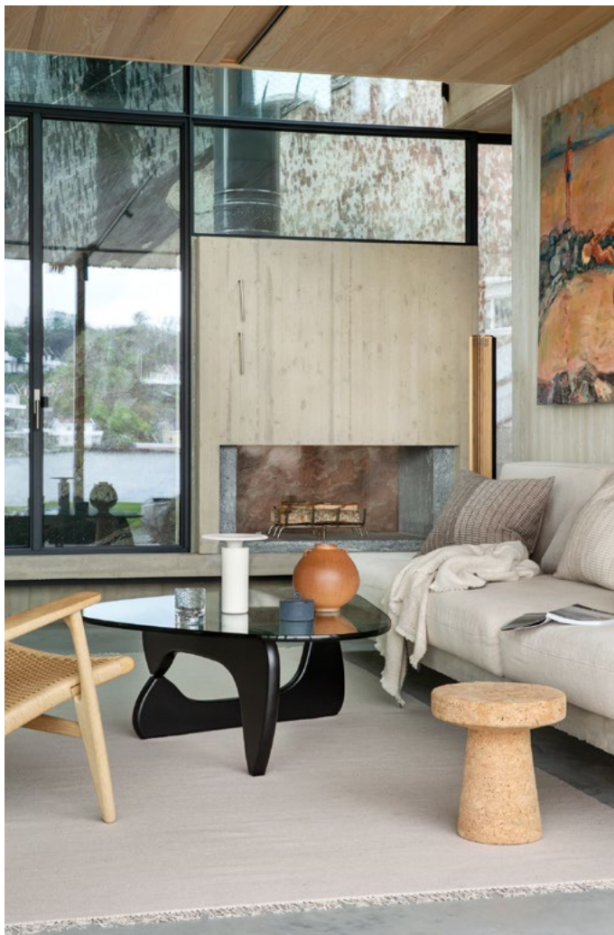
Fra stuen, mot peisen og fjellveggen bak. Lune materialer og grafiske former.