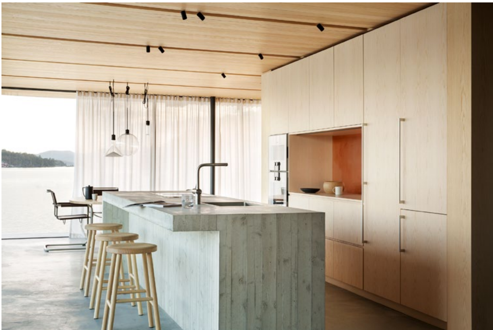
Kjøkkenet med utsikt. Kjøkkenøy i betong, krakker i ask. Bak kjøkkenøya ser vi et spesialtegnert spisebord i heltre ask. Spiler av massiv ask er samlet i en form på midten, og frigjør plass for stoler til fritt å plasseres rundt bordets kant, og gir en fleksibilitet i møblingen.