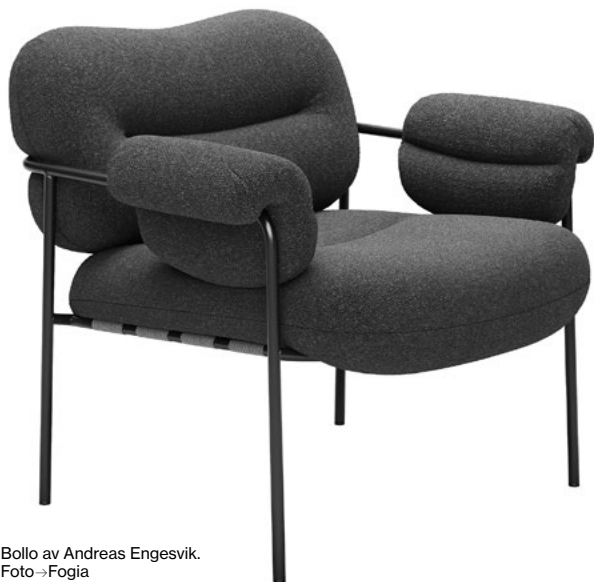
Bollo av Andreas Engesvik.