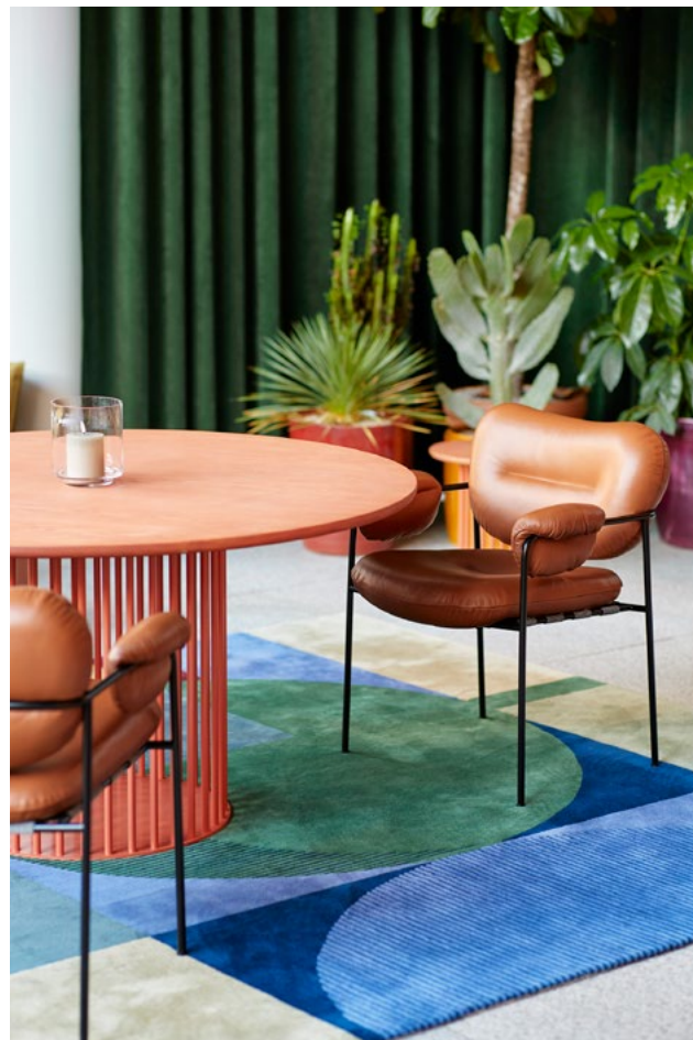
Bollo i bruk hos Gjensidige. Her sammen med en bordserie designet av I-d Interiørarkitektur & Design og produsert av HMI for Gjensidige. Prosjekt på side 106.