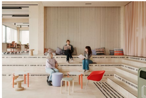
For første gang trekker vi frem årets bærekraftprosjekt. Les om prosjektet HasleTre/Redd Barna-huset av I-d Interiørarkitektur & Design i samarbeid med Romlaboratoriet på side 25.

Den posisjonen profesjonene har i dag, har ikke kommet uten kamp. Det er mange som har gått foran og ryddet vei, men den kan fort forvitte hvis arbeidet ikke fortsetter. Vi jobber ut fra en grunnleggende sterk base fundamentert på faglig kunnskap og kompetanse, samlet styrke, en effektiv foreningsstruktur – og ikke minst – en positiv tone og samarbeidskultur innad i NIL.