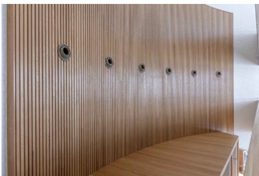
Detaljstudie av spilevegg som ligger som et bakteppe for sittealkovene. Integreert ventilasjon. Spileveggen sammen med akustisk demping inni alkover og utenpå broer, har gjort Vinterhagen til et fantastisk godt sted å være!