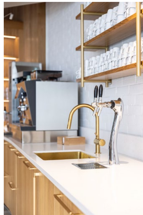
Spesialtilpasset kjøkken som en homogen forlengelse av sittealkove. Eik, messingdetaljer og Corian benkeplate med oppkant mot vegg. Spesialtilpasset spalte bak oppkant for lufting.