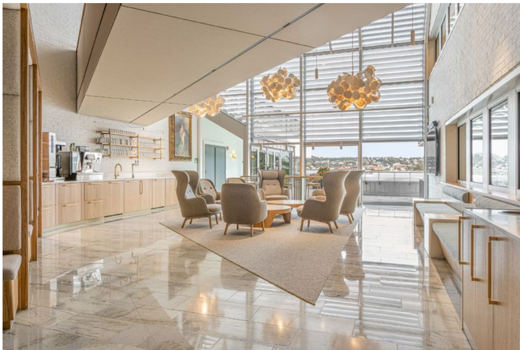
Vinterhagen, utsnitt fra inngangsdør med sittealkover til venstre og miljøstasjon til høyre, etterfulgt av sittebenk. Alt spesialtilpasset og utført av Sørensen & Moen i Arendal.