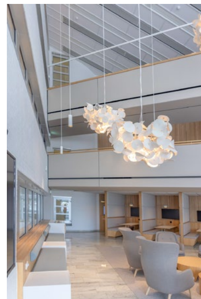
Presise møter mellom Softcells-kledningen fra Kvadrat og veggen. Her er det ingen 90 graders vinkler! Meget godt håndverk både fra Kvadrat og Sørensen & Moen som tok mål på stedet og monterte elementene.