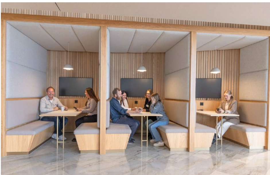
Sittealkovene er godt lydisolert og fungerer både for planlagte og spontane møter, arbeid med laptop eller en uformell samtale over en kaffekopp.