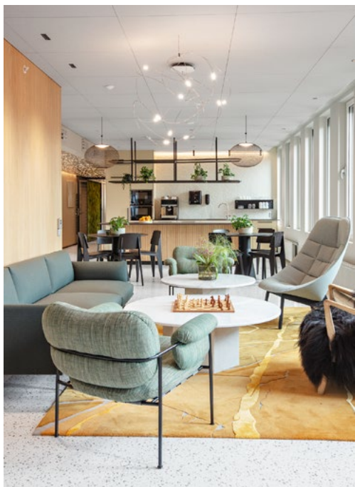
Varme, nøytrale trefarger, solrike toner og dype grønnfarger er kontrastert av myk grønn og mørk rød murstein over en lys og lett basepalett.