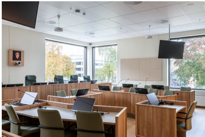
Rettssalene er fargesatt i enten grønt eller blått. De fleste salene har farge på fondvegg med tilhørende fargetema på de nyinnkjøpte stolene. Her med grønne tekstiler på dommerstolene og aktorplassene.