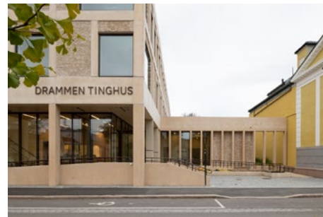
Fasade og forplassen. Store glassfelt i 1. etasje gjør at tinghuset oppleves mer åpent og imøtekommende.

IARK og Add arkitekter har samarbeidet tett om en helhetlig farge- og materialpalett, slik at eksteriør og interiør spiller på lag. Fra fasade, gulvoverflater, spilehimlinger, finish på stålprofiler, fliser, fuger, veggfarger og tekstiler, er alt sett i sammenheng og vurdert i detalj for alle tinghusets funksjoner. De startet prosjektet med å bli med arkitekten til Loe betongfabrikk