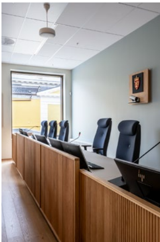
Detalj av dommerbordet som har en opphevet og fremskutt del foran hoveddommerne. Utenfor vinduet kan man se den gule frimurerlogen.