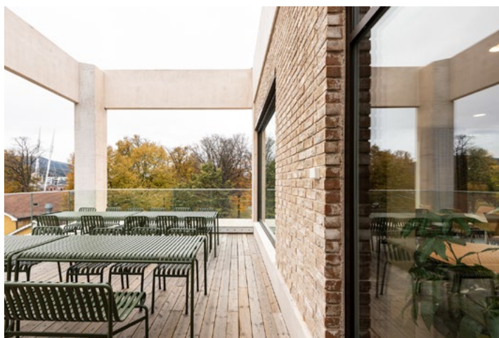
Takterrasse utenfor spiserommet hos tingretten og jordskifteretten.