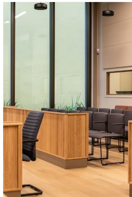
I salene brukte man eik i bordfrontene for å tilføre varme og tekstur.

for finne frem til fargetone til betong i fasade. I arbeidsmøter utviklet de en varm interiørpalett med lyse og gylne toner på vegger og dører. Dette samsvarer med de sandfargede betongelementene, teglfeltene og vinduer i bronseeloksert aluminium.