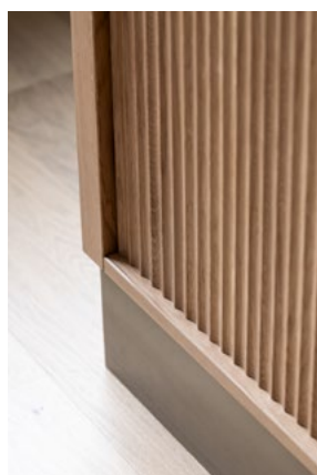
Detalj av bordfront i rettssalene, eikeplate med utfreste riller. Sokkel i lakkert metall.