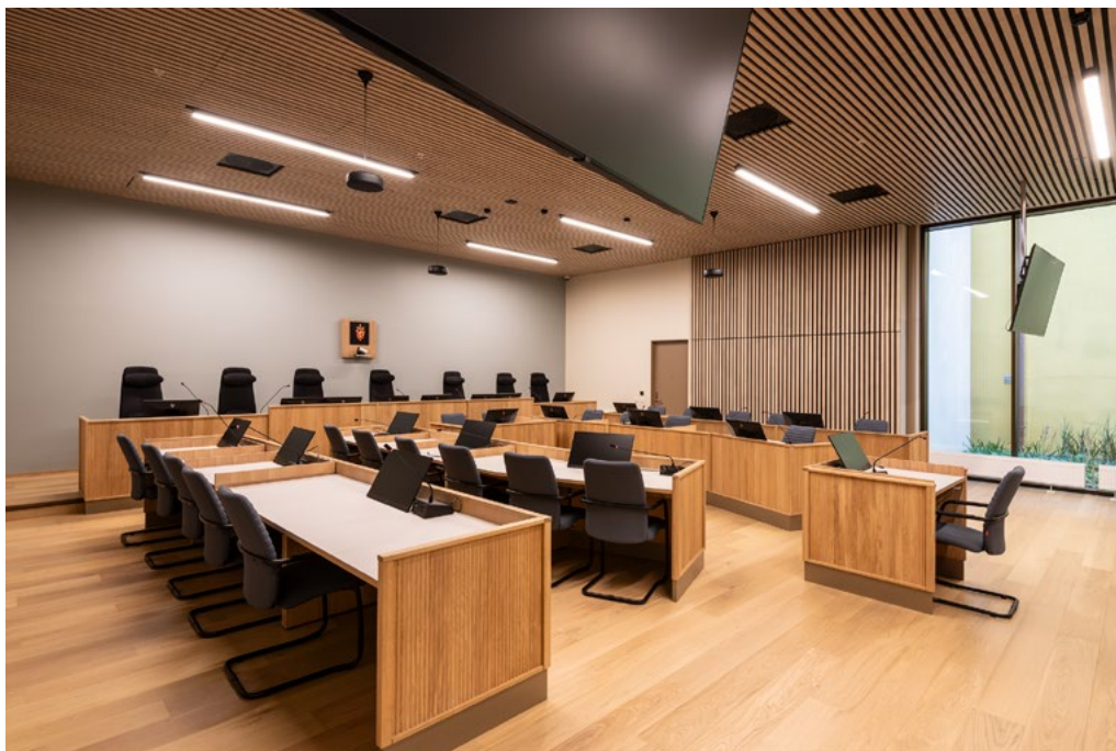
Den største rettssalen på plan 1 er på 136 m 2 og mest påkostet med eikespiler i himling og vegger for akustisk demping. Blå fondvegg og aktørstoler i blåtoner. Pressebenk og publikumplasser med løse stoler i rekke, og alltid med sofabenker på bakerste rad inntil vegg.