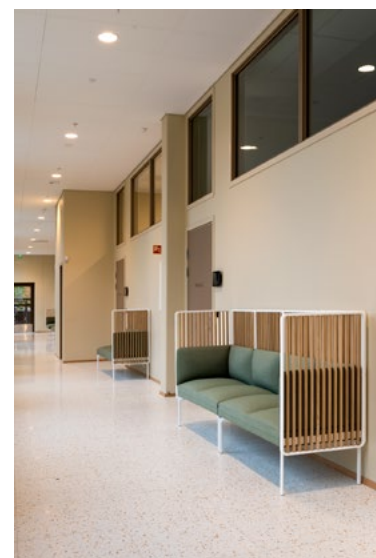
Møbler med spiller gir delvis skjerming, samtidig som ventesonene holdes oversiktlig.

I salene brukte man eik i bordfrontene for å tilføre varme og tekstur i form av utfreste riller. Bordplatene er dekket med myk og lyddepnende furniture-linoleum.