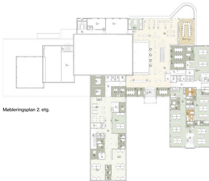
Møbleringsplan 2. etg.