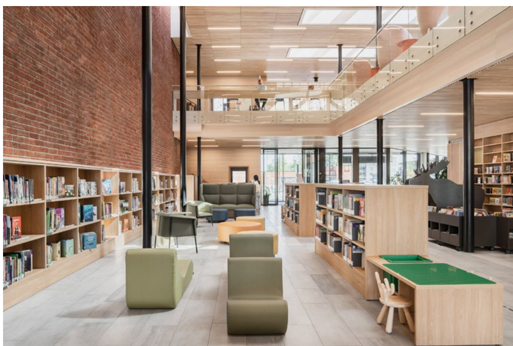
Barneavdelingen er plassert i bibliotekets første etasje for å gi lett adgang til besøkende barn og foreldre.

All biblioteksinnredning langs vegger går til tak hvor det var mulig, og danner på den måten en lun ramme i eikefiner over to etasjer. Interiøret er preget av materialenes naturlige fargepalett bestående av trespiler i eik og ask, lys Oppdalskifer i fellesoner på plan 1, plasstøpt betong, lyse teppe- og linoleumsgulv i kontoretasjer.