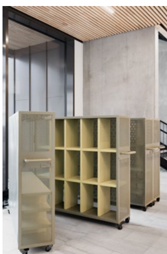
Cadi utviklet mobile garderøber for oppbevaring av skolesekker, skotøy og ytterklær for barnehager og skoleklasser som besøker biblioteket.