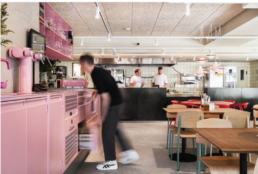
Den intense rosafargen på kjøkkenøya, er lokalets blikkfang og herlige omdreiningspunkt.