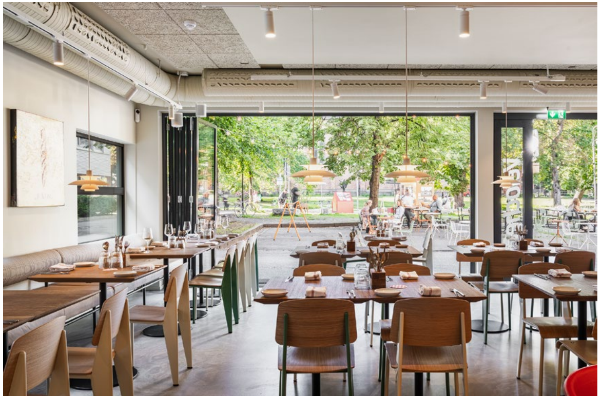
På plassen foran Vélochef er det blitt opparbeidet en ny plass med solstoler og sittemøbler.