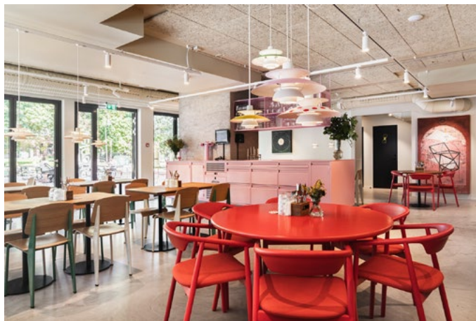
Møbleringen er enkel og ikke så dekorert; klare fargeflater, objekter med tydelig identitet er stilt opp mot betongen.