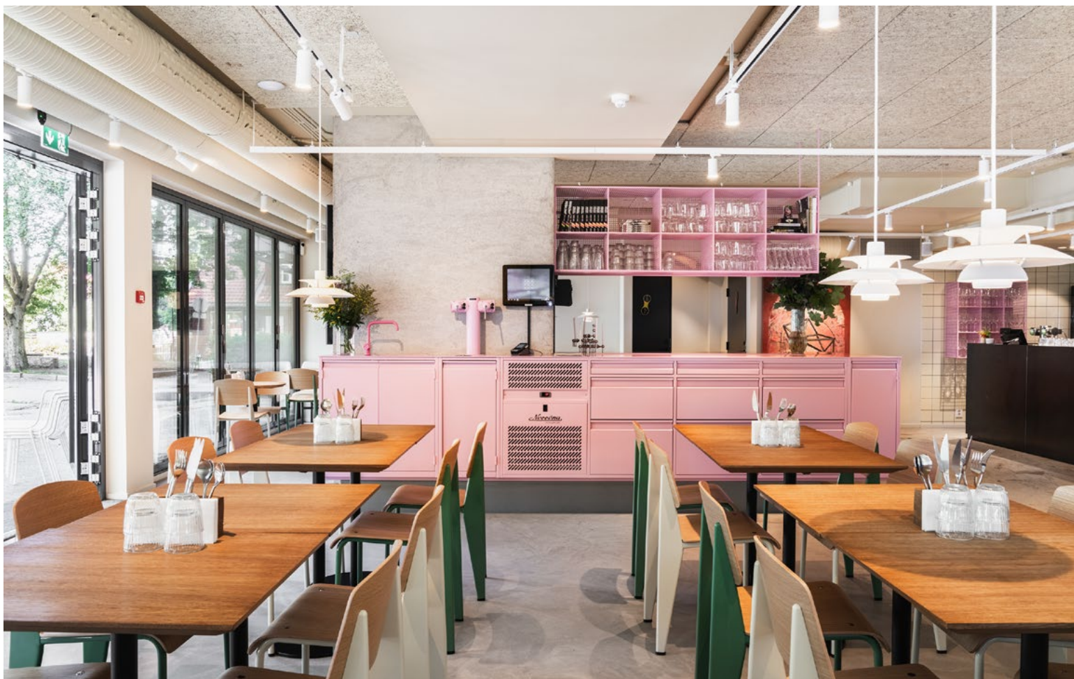
Lokalet ble strippet ned og står rått tilbake. Interiøret er basert på en sterk og klar fargepalett, hentet fra sykkel sportens egne symbolfarger.