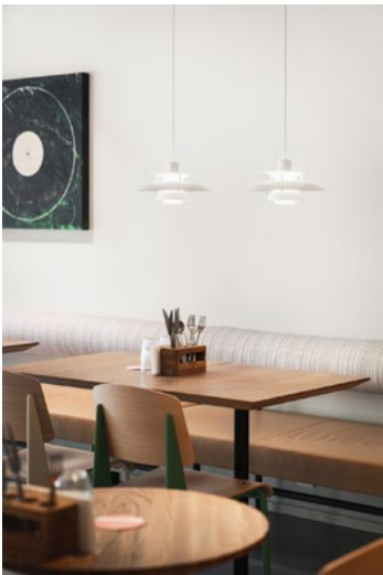
Radius design har utarbeidet design av all fast innredning, som er produsert og levert av Nordic Furniture.