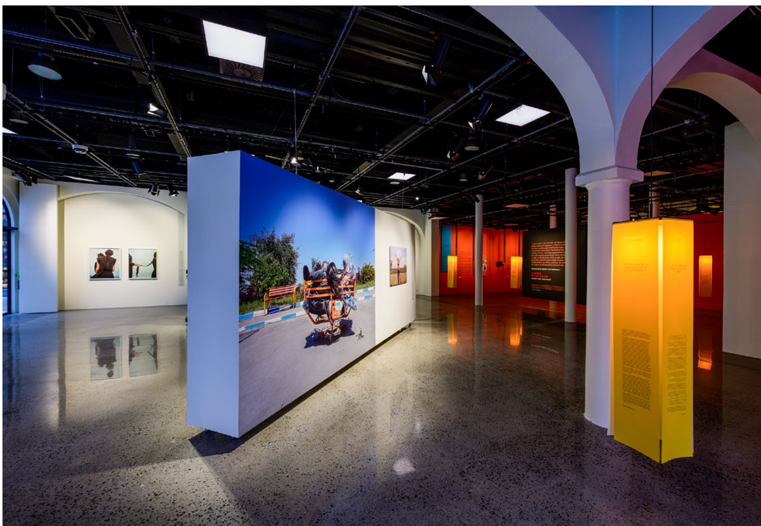
Kontrasten mellom de to utstillingsdelene er tydelig. Det var viktig for fredsprisvinneren og fotografene at hver del skulle kunne forstås uavhengig av den andre. Minnelanternene med tekster på tre språk var både følelsesladet og et viktig estetisk grep.