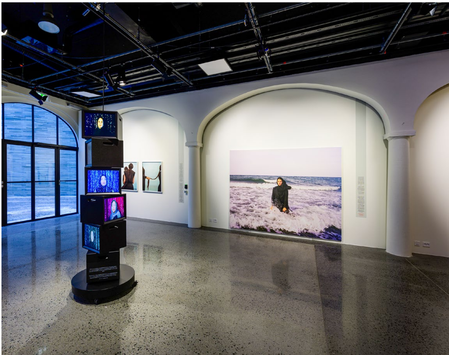
Videoinstallasjonen til Newsha Tavakolian var plassert fritt på gulv for å kunne oppleves fra alle sider mens betrakteren selv gikk rundt i rommet. Svarte valchromat-kasser med innbyrdes kobling ble designet for å ligne vintage monitører.