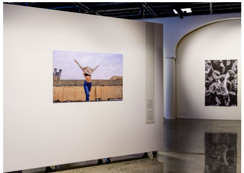
Bevisst innbyrdes plassering av foto i henhold til siktlinjer skapte interessante og veloverveide perspektiver som her: Kvinneopptøyer fra revolusjonen i 1979 møter kvinneopprør fra 2023.