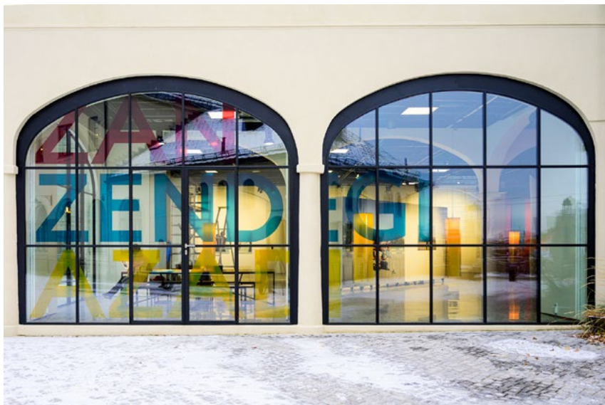
«Zan – Zendegi – Azadi» (Kvinne – Liv – Frihet på farsi) på vinduene mot Nasjonalmuseet og Rådhuskaia er både en hyllest til iranske kvinner og en utstillingsplakat for alle som passerer.