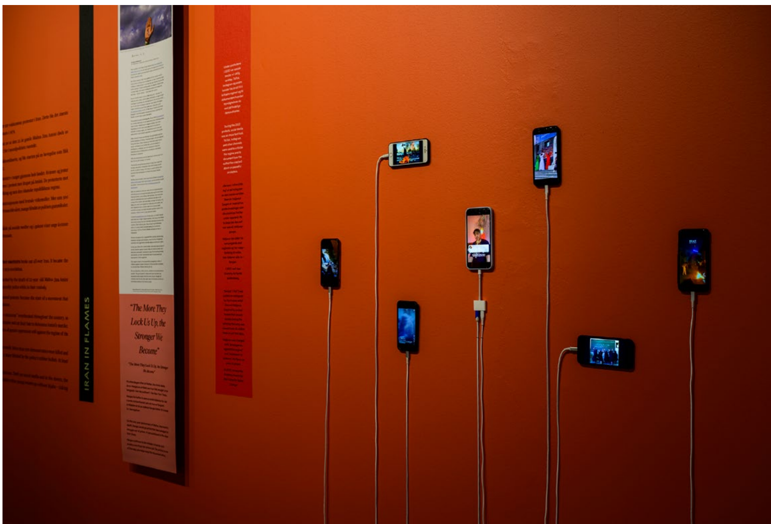
TikTok-installasjonen viste sosiale mediers innflytelse som informasjonskanaler i kampen for frihet og demokrati verden over. Videoene ble vist i gjenkjennelig format, på mobil tilkoblet lader.