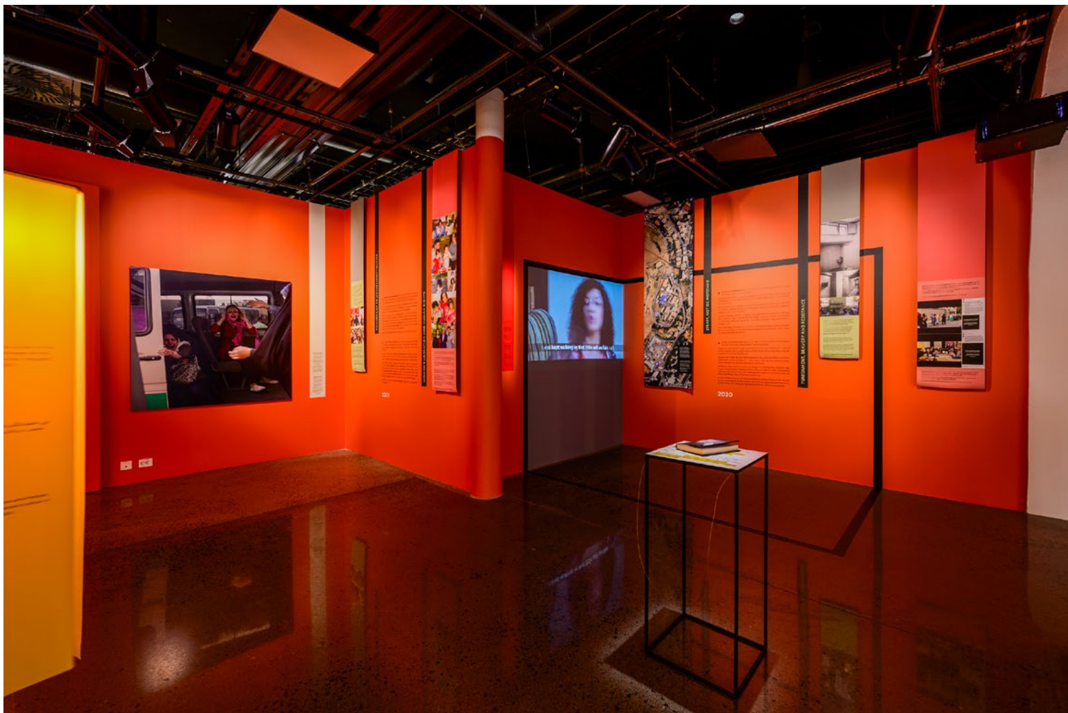
Utstillingsinnholdet var tematisert. Wireframe-grepet ble brukt for å samle temaet om Evin-fengslet. Boken White Torture er plassert på podiet, mens film med samme navn vises innenfor et format som gjengir målene på fengselets isolatceller.