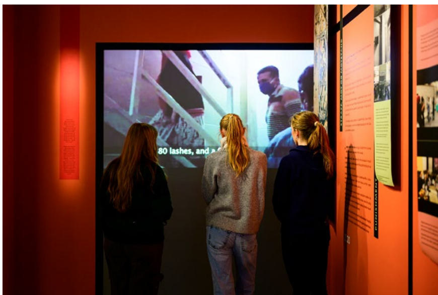
Tematekster tok form av folie på vegg, mens øvrige tekster og foto ble printet på tapet og montert hengende løst fra overkant vegg. Samarbeidet med grafisk designer var tett. Produksjonen var fleksibel og tillot korrekturlesning og endringer i plassering til langt ut i prosessen.