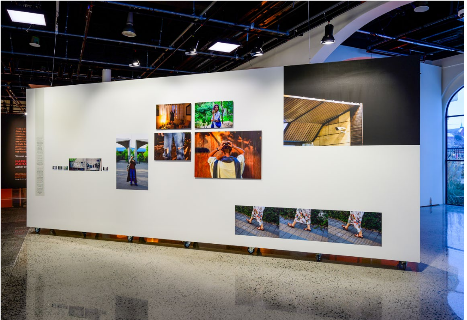
Fotografiene på den 6 meter lange mobile veggen i form av wallpaper er kombinert med utenpåliggende print på Dibond-plater og polaroider. Et grafisk og nøye regissert uttrykk.