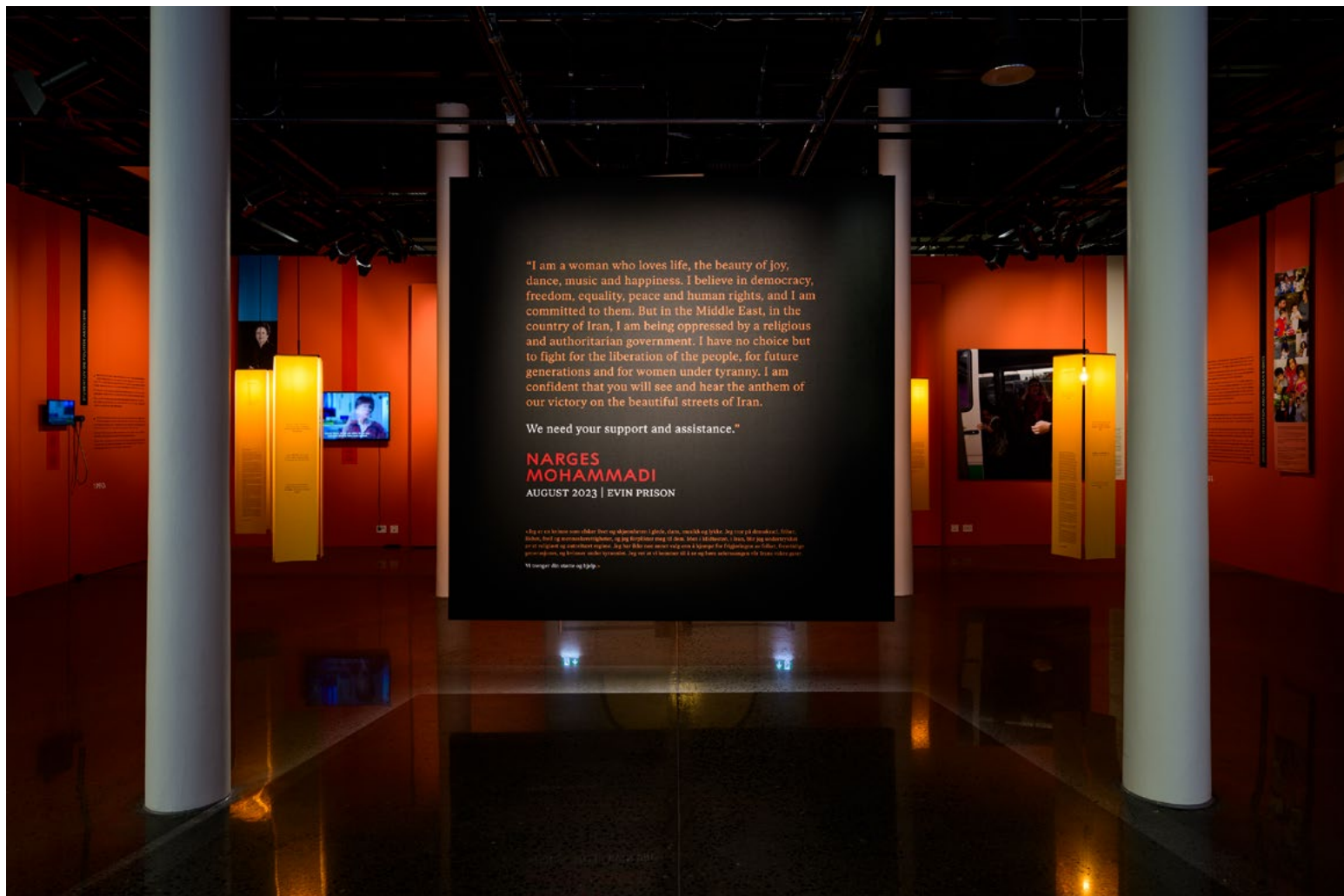
Å legge til rette for sterke etterlate inntrykk utløste bevisste designvalg. Baksiden av introveggen ses mot den glødende oransje bakveggen. Prisvinnerens emosjonelle appell ber besøkende om støtte for kampen i Iran.

Fotografer og motivene kunne stemples som dissidenter av regimet i Iran – med fare for liv og helse. Utstillingen ble derfor «splittet» i to, slik at delene kunne detaljeres i ulikt tempo, mens jurister og Iran-eksperter kvalitetssikret fotografier og kilder.