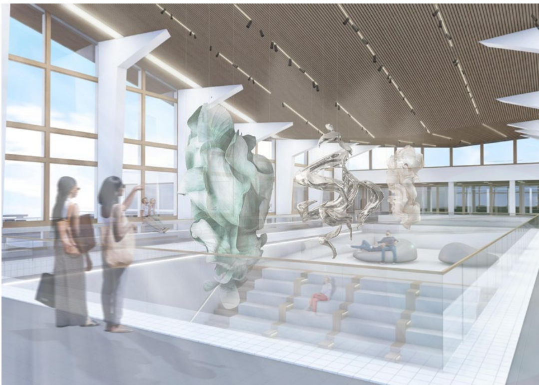
Illustrasjonen viser Alheim Svømmehall i Tromsø omgjort til et kunst-, design- og arkitektursenter. Illustrasjon → Idunn Alsos Sandbakk.