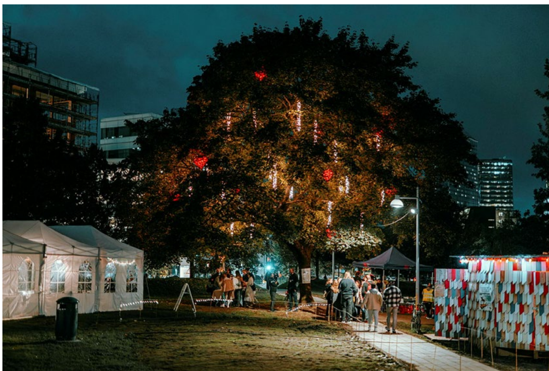
Masterstudentene stilte ut sine installasjoner av gjenbrukte/ombrukte materialer som skulle «avvikles» på en så bærekraftig måte som mulig under «Kunst på Elgsletta» i fjor høst.