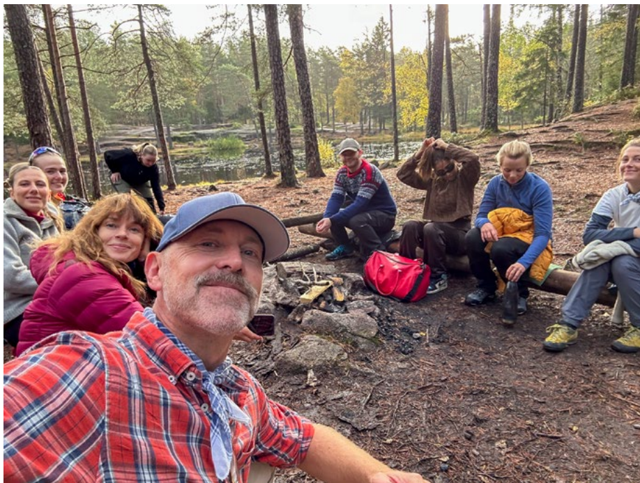
Masterstudentene hadde flere dager i skogen under emnet Abstraksjon, der studentene skulle utforske hvordan bruke abstraksjon som metode i sine kreative arbeidsprosesser.