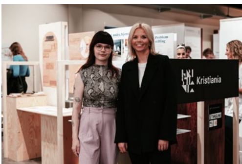
Interiørarkitekt-studentene fra Høyskolen Kristiania stilte ut sine arbeider under Designers Saturday i fjor høst. Standen bygget de selv.