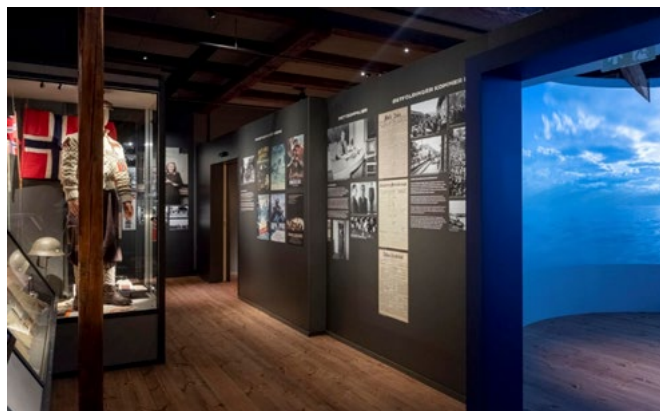
Fredsdagene. Etertanken. Steenslandsrommet inn til høyre, med egen audiovisuell produksjon: Askeladden.