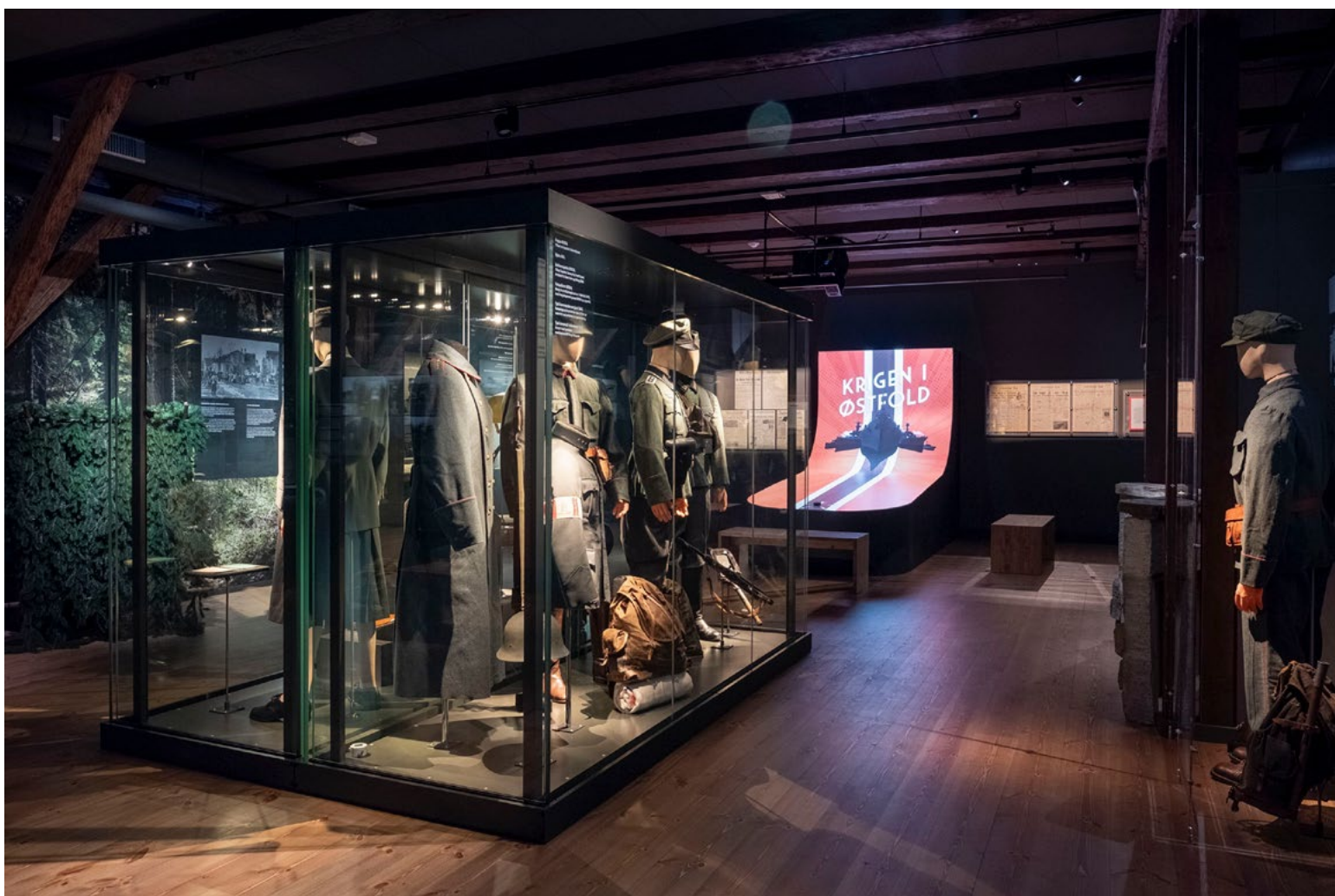
Rauøy fort og Østfold var de første som ble berørt da de tyske invasjonsstyrkene kom natten mellom 8. og 9. april 1940.

Den starter med et fredelig, nøytralt Norge, leder oss videre via krigsseilerne «langt borte» til vår støtte til soldatene i Finland, før det kommer varslere om mobilisering. I neste rom vises Tysklands brutale angrep på Norge, med all den lidelse det medførte. Dernest vises nasjonal samlingspropaganda, okkupasjonsmakten og dens virkemidler, men også dagligliv, motstandskamp, flukt, etterretning, heltedåder og Østfoldinger på utefront. Og til sist den tyske kapitulasjonen, jubelen, fredsdagene, men også ettertanke, sorg over de falne og den spente situasjonen rundt landssvik og pågripelser.