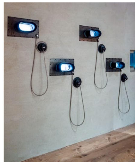
Titteskikkertene i bunker-installasjonen er montert i to høyder, for å være tilgjengelig både for stående og barr/sittende publikum.