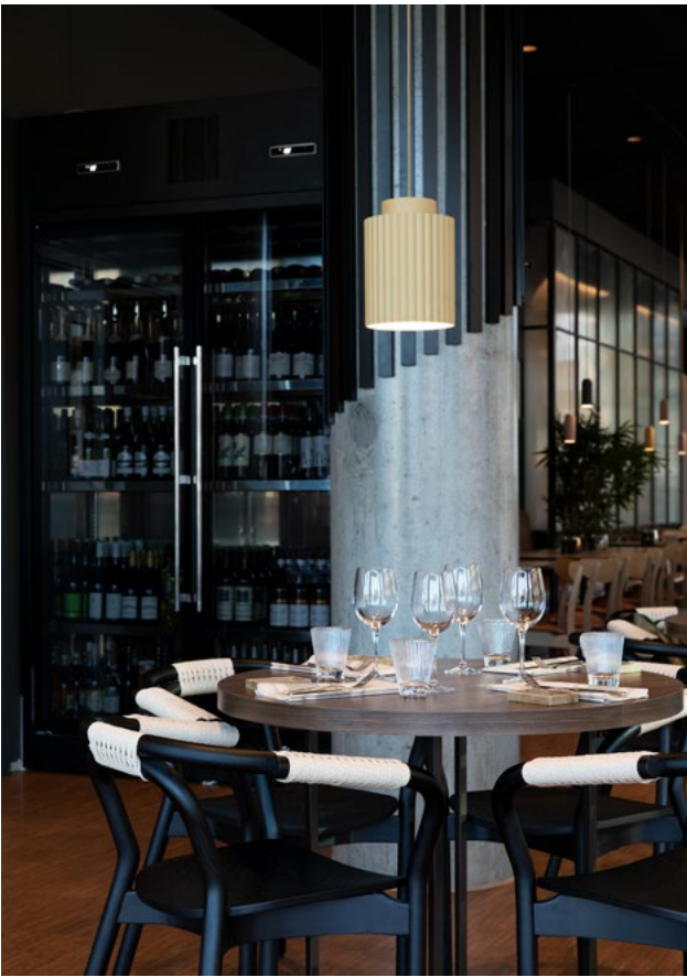
Restaurant Brasserie X.