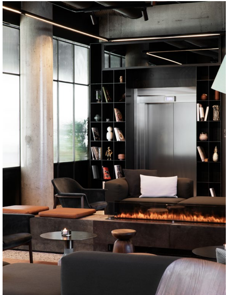
Resepsjon og lobbyområde.