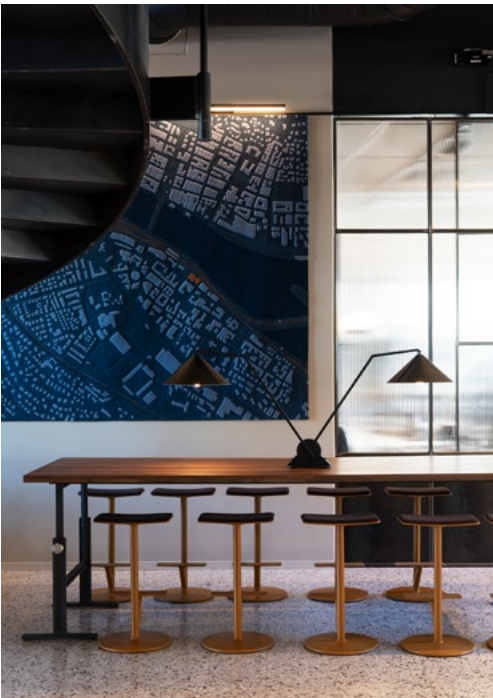
Interiørarkitekten designet et veggteppe med utsnitt over Drammensområdet.