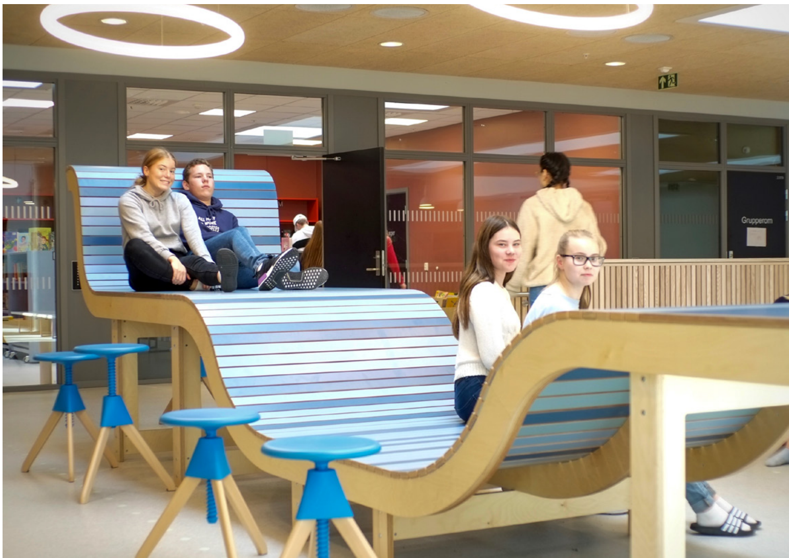
Den blå bølgen på toppen av amfiet er «Himmelrommet, der kan ungdommen slenge seg rundt, man kan ligge og se opp gjennom skyligheten på nordlys og stjerner». I Himmelrommet er benken mye bredere, den hviler mer, er enklere i formen. Dette er et roligere sted.