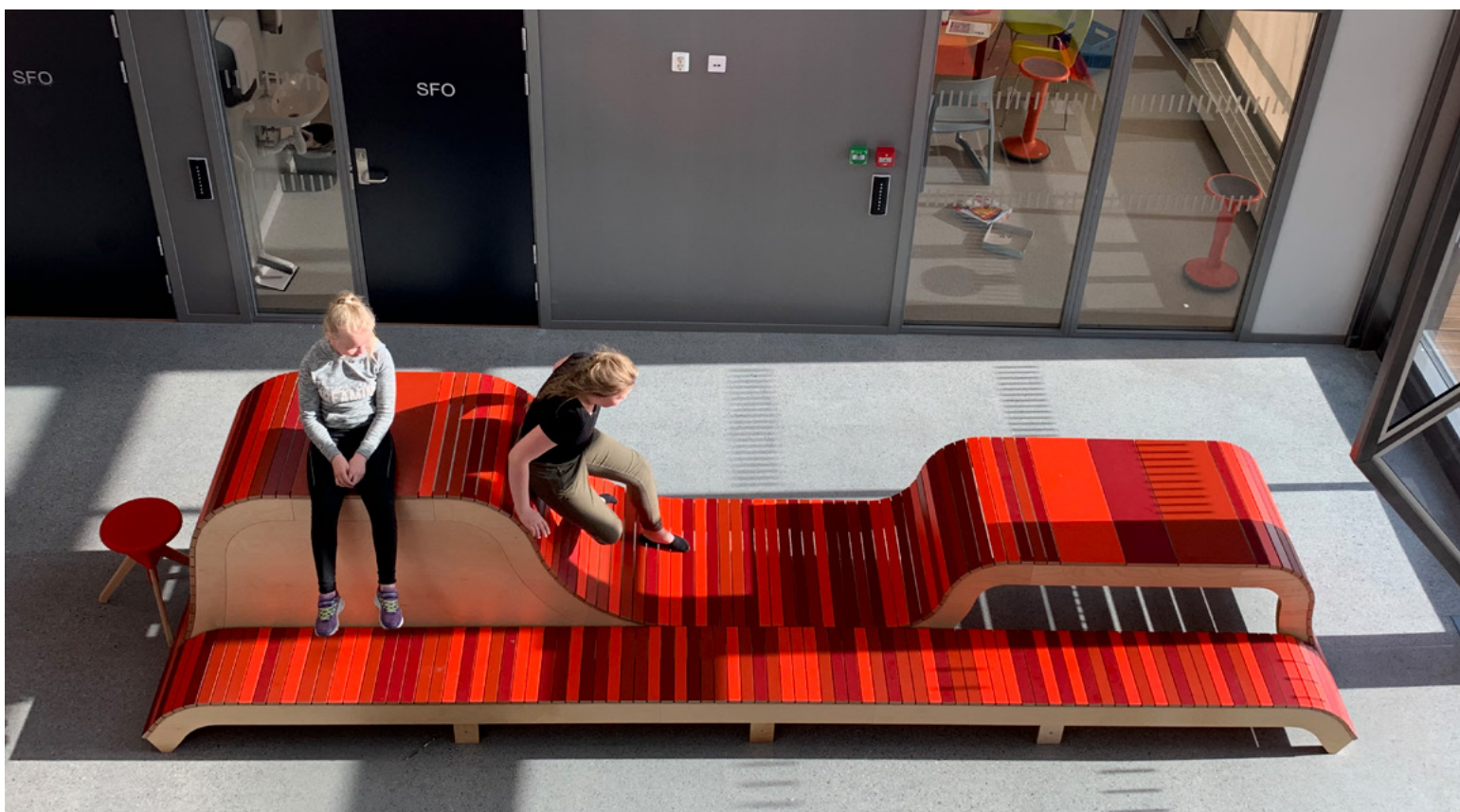
Kantine. Sterke farger, stor og kraftig form – rom for alle.