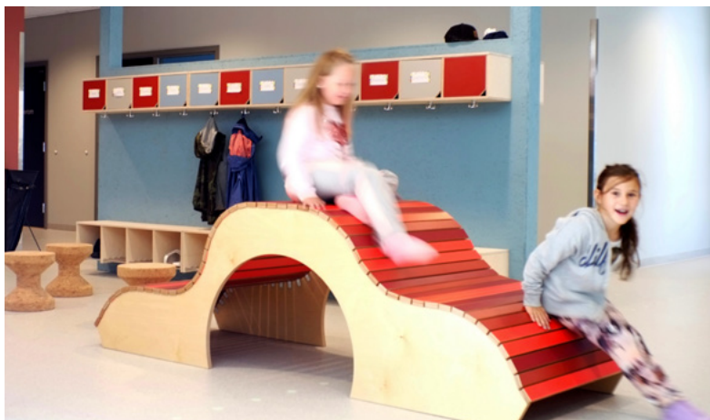
Minibølge i hjemmebasen. Enkel og morsom. Møbler som kan ta ut litt aktivitetstrang.