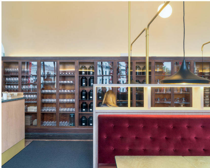
I Kafé Å i 2. etasje ble det skreddersydd både belsningsarrangement og sofa. Den hyggelige atmosfæren i kafeen tiltrekker seg også studenter på dagtid og besøkende i forbindelse med foredrag på kveldstid.