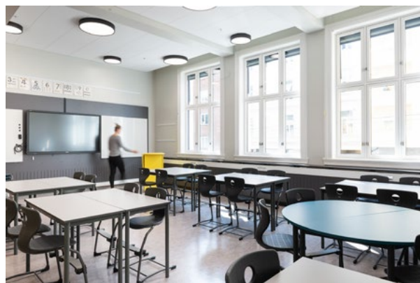
Alle klasserom er lyse og luftige, med generøs takhøyde og store, flotte vinduer. Møblene legger til rette for god ergonomi og fleksibilitet, for å gi elever og pedagoger best mulige arbeidsforhold.