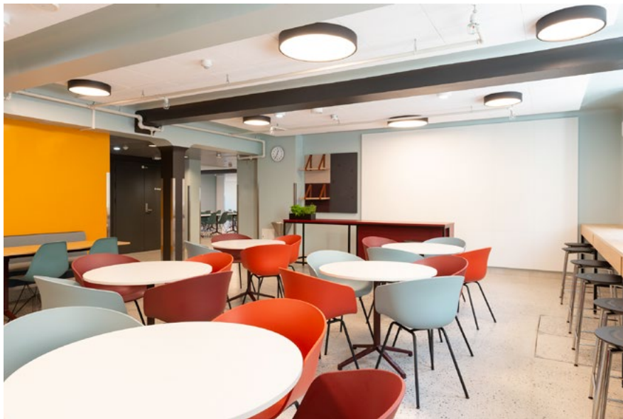
I kantinen kan elevene finne sin favorittplass, enten det er ved ståbordet langs fasaden, i en av sofaene eller samlet rundt et av de runde bordene. De store vinduene gir god kontakt med livet ute på fortauet. Den frittstående disken legger til rette for elevenes egen drift av kantina, hvor de kan sette sitt eget preg på lokalene med håndskreven meny og utstillingsplass på hyllene i bakkant. Disken kan ellers brukes som et frittstående ståbord med barkraker rundt.