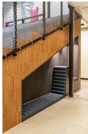
Et plassbygget møbel i to høyder utnytter plassen under amfiet i kulturrommet, og skaper en hule hvor man kan gjemme seg litt unna, med den nye favorittboka eller et spill. Sitteplasser i flere høyder gjør at man kan være flere sammen, uten å forstyrre hverandre.