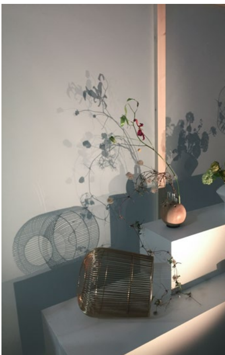
Skillet mellom interiør og natur viskes ut.