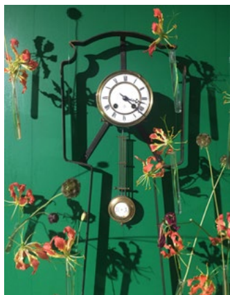
Lette gloriosa leker i rammen til vegguret.