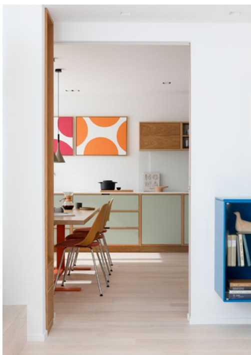
Fra gangen går det en fin siktlinje gjennom stuen og videre inn i kjøkkenet. På veien skimtes en knallblå Montana-skjenk som fører seg inn i kjøkkenets fargepalett på en god måte.