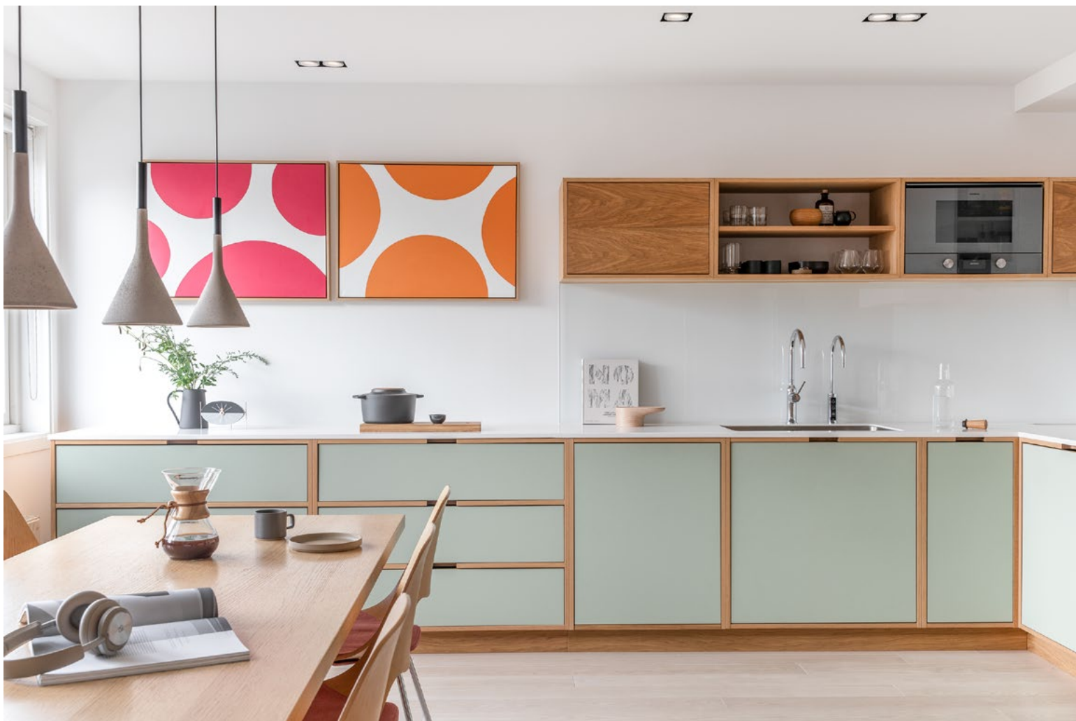
Materialpaletten består hovedsakelig av hvitpigmentert ask (gulv) og oljet eik i kombinasjon med pistasjfarget linoleum.