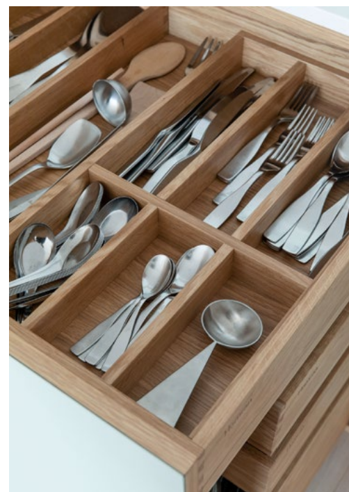
Innsiden er like viktig som utsiden og kvaliteten ligger i detaljene. Her har alt sin faste plass.