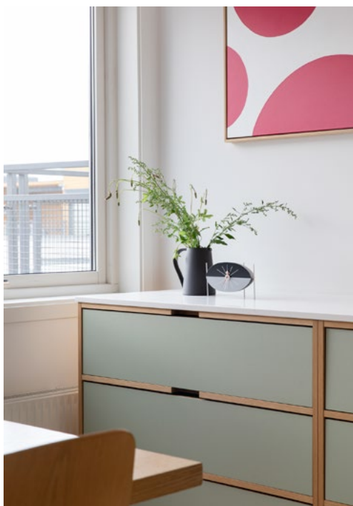
Benkeplatene i hvit Corian oppleves diskret og glir nesten sømløst over i veggene. Spor i skrogene gjør at man får grep om frontene og skaper samtidig et stramt og grafisk uttrykk.