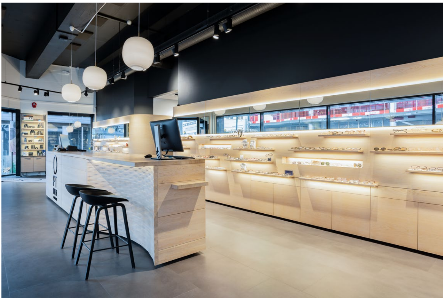
Disken og hyllene er skulpturelle former som opphøyer utstillingen av brillene. Kundene vil oppleve butikken mer som et galleri.

hyller og disk – skreddersydd for deres merkevareuttrykk.