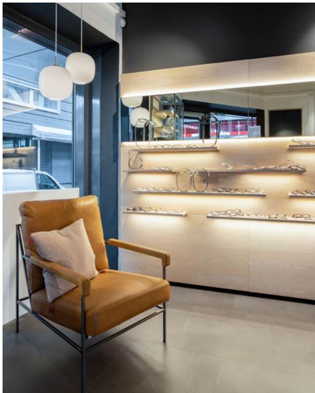
Den åpne glassfasaden og skjulte LED-belysningen i hyllene er designet for å synliggjøre inventaret mot gaten.