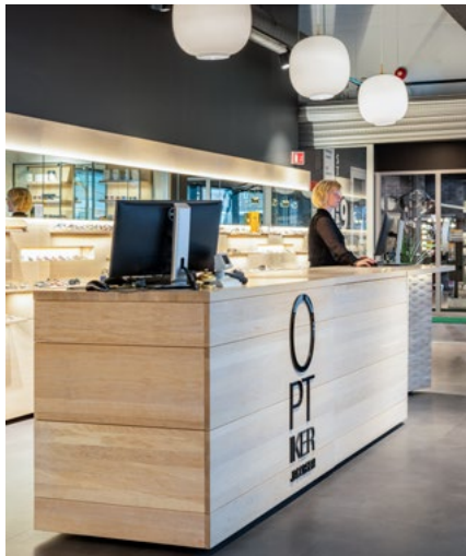
Det er utstrakt bruk av heltre i salgsdisken og i hyllene. Interiør byttes ut ofte og skaper mye forurensning i form av avfall. Massivt treverk er i seg selv et miljøvennlig og bærekraftig materiale og kan lett bygges om dersom bruken endres.