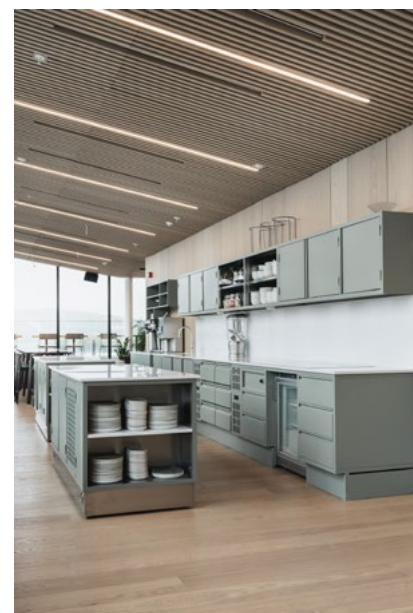
Sosiale soner med bar og lounge, kantinekjøkken med lange barbord og spisebord for lunsj og middager.

på plan ni, er det i hovedsak cellekontorer og kontorlandskap, kreative fellesrom og interne møterom.