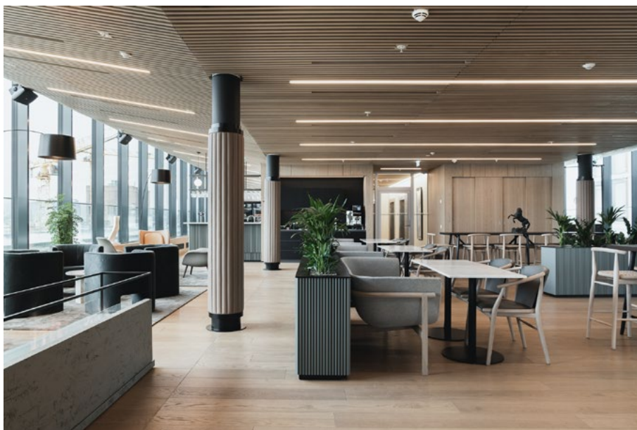
Den offisielle sonen med en generøs planløsning, der man ønsker å åpne for aktivitet utenfra; samle mennesker til samtaler, debatter og foredrag.