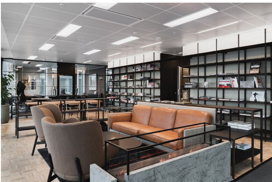
10. etasje deles inn i en møteromsavdeling, samt et mer privat område. Her finnes også eiernes og ledelsens egen og mere skjermede sone.