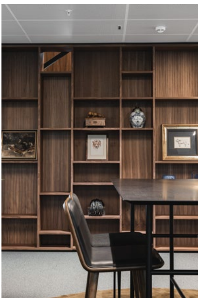
Spesialdesign med bruk av varige materialer.