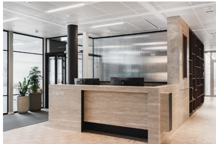
Resepsjonsdisk på 650 kg i travertin, heltre eikegulv og matt puss på alle vegger reflekterer byggherrens verdiperspektiv.