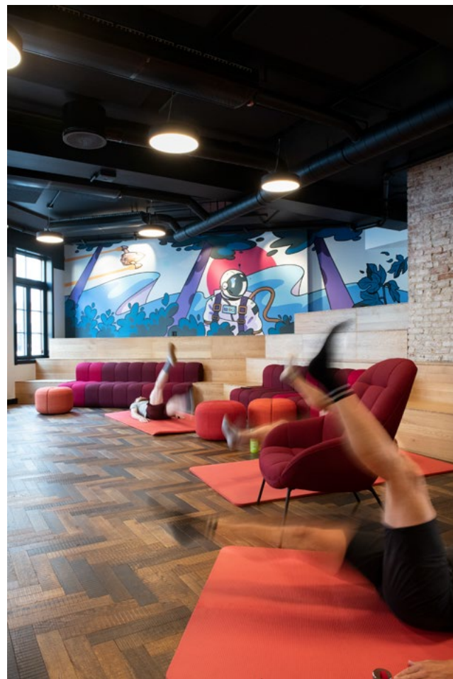
Morgentrim er en del av hverdagen hos Fiken.