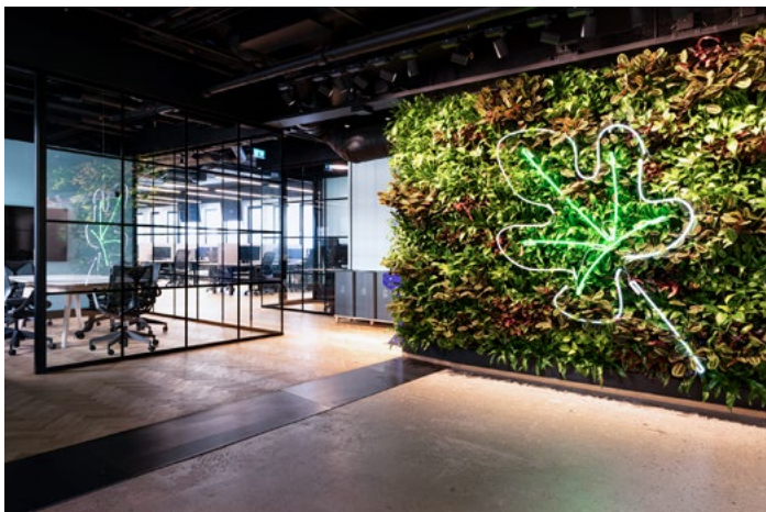
En plantevegg med fikenbladet ønsker velkommen på jobb.