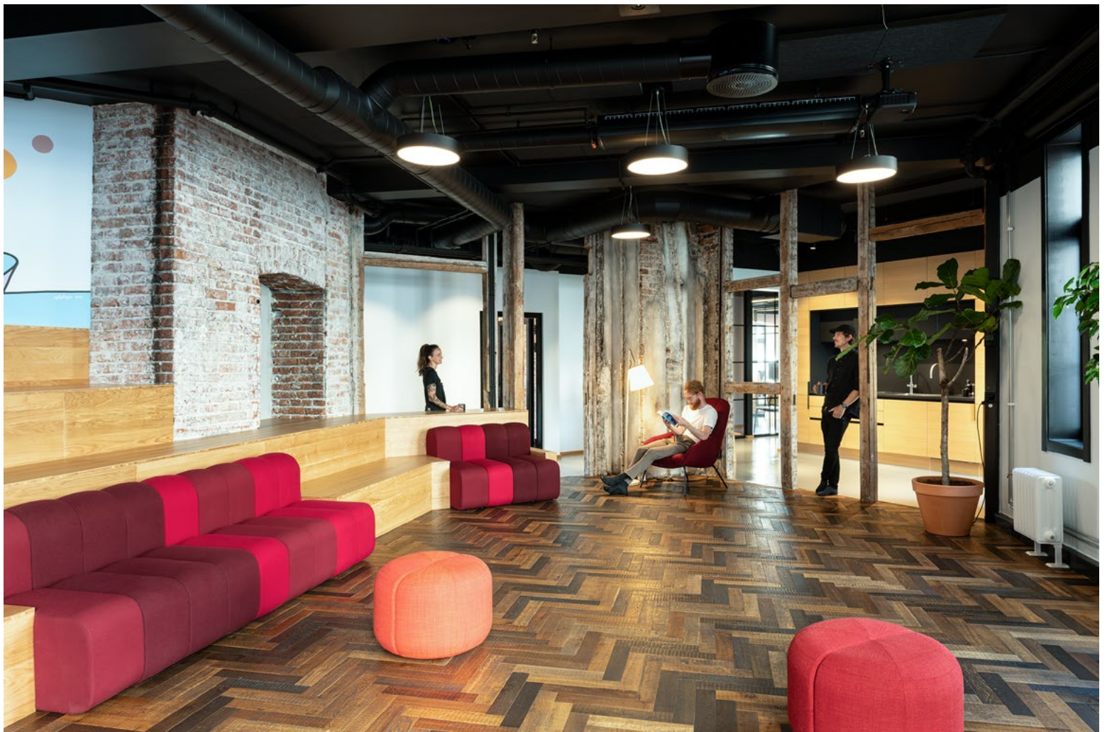
Sofamoduler integrert i amfitrinnene gir økt komfort og utvidet bruk av allrommet.