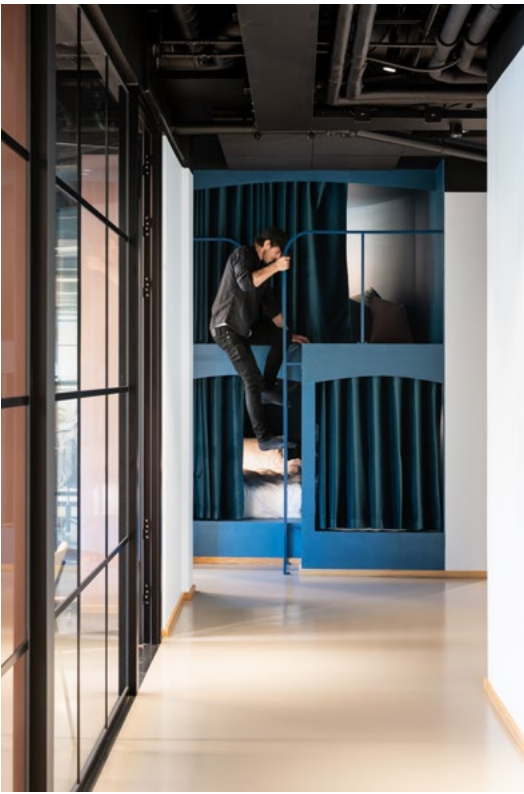
Fiken oppfordrer til en «power nap» i arbeidstiden.

Høye glassvegger og dører understreker den rause himlingshøyden.