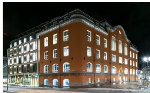
Rødbanken ruver i bybildet. Den ærverdige banken er flankert av Stengården og Nybygget og har blitt en storstue i Tromsø sentrum.