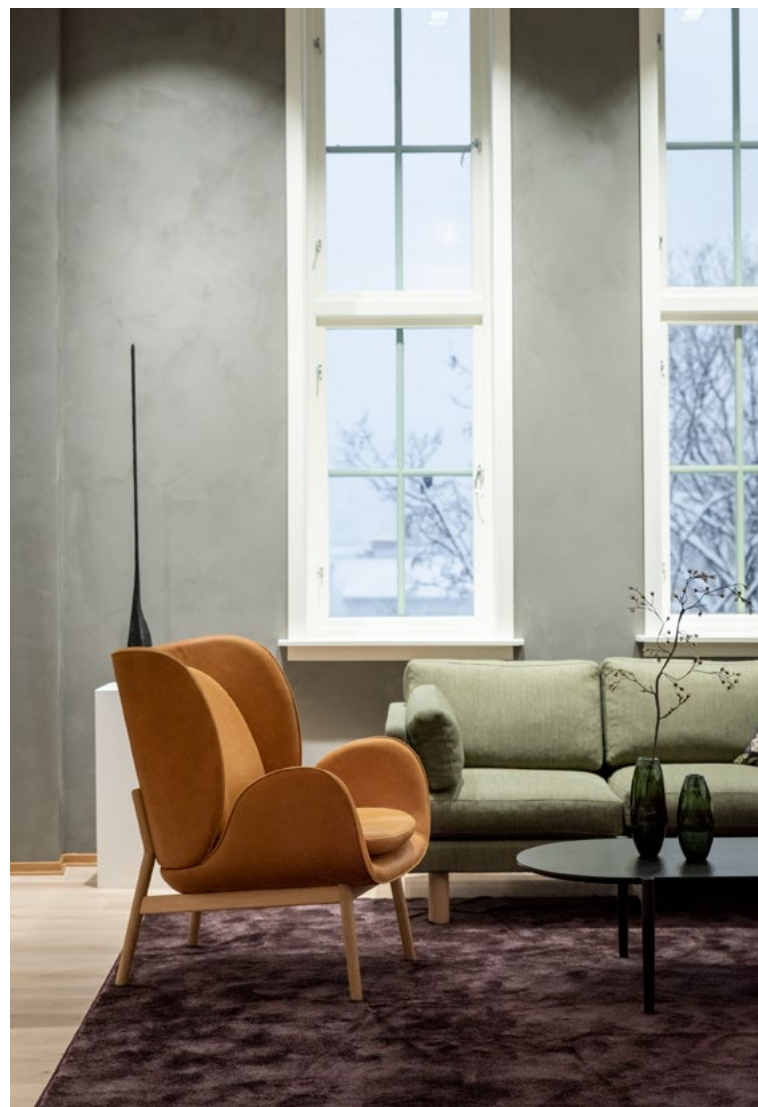
I Rødbanken er fargepaletten basert på byggets ikoniske rødfarge og de historiske interiørens opprinnelige fargepalett i flaskegrønt og varme toner.

for alle lokasjoner rundt om i landsdelen, og tilpasset hovedprosjektet. Kundearealer er spesielt utviklet i tråd med øvrige lokasjoner for å skape helhet og gjenkjennelighet. Fargevalg og materialitet i kundearealer og arbeidssoner speiler det nordnorske lyset med kalde blåfarger og blek rosa. I Rødbanken er materialer og farger tilpasset det historiske bygget med dypere og lunere farger og referanse til byggets røde fasade og grønne interiør.