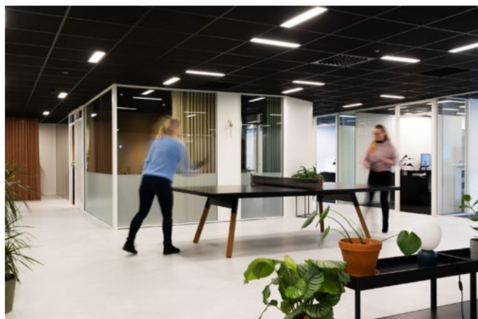
Ett av ønskene fra oppdragsgiver var å få inn et element som oppfordrer de ansatte til aktivitet i løpet av dagen, siden mye av arbeidet for regnskapsførere er stillesittende. Valget falt på et ping pong-bord fra RS Barcelona, som også kan brukes som ekstra møte-/prosjektbord ved behov.