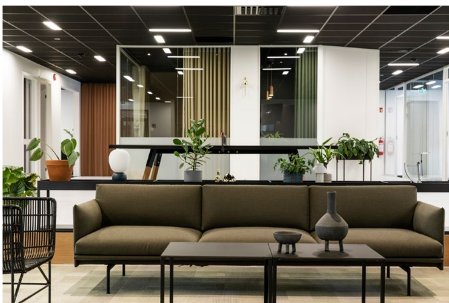
Oppdragsgiver manglet soner hvor det var naturlig for kolleger å samles utenfor kontorene, og for å ta imot gjester utenom å benytte møterommet. Det ble derfor etablert en sosial sone ved inngangen til kontorene.