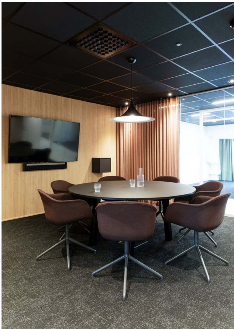
Det ble etablert nytt møterom mellom eksisterende cellekontorer og gavlvegg på bygget. Selv om møterommet ligger midt i bygget får det dagslys gjennom glassvegger på to sider. På veggen bak skjermen er det lagt bambustapet.