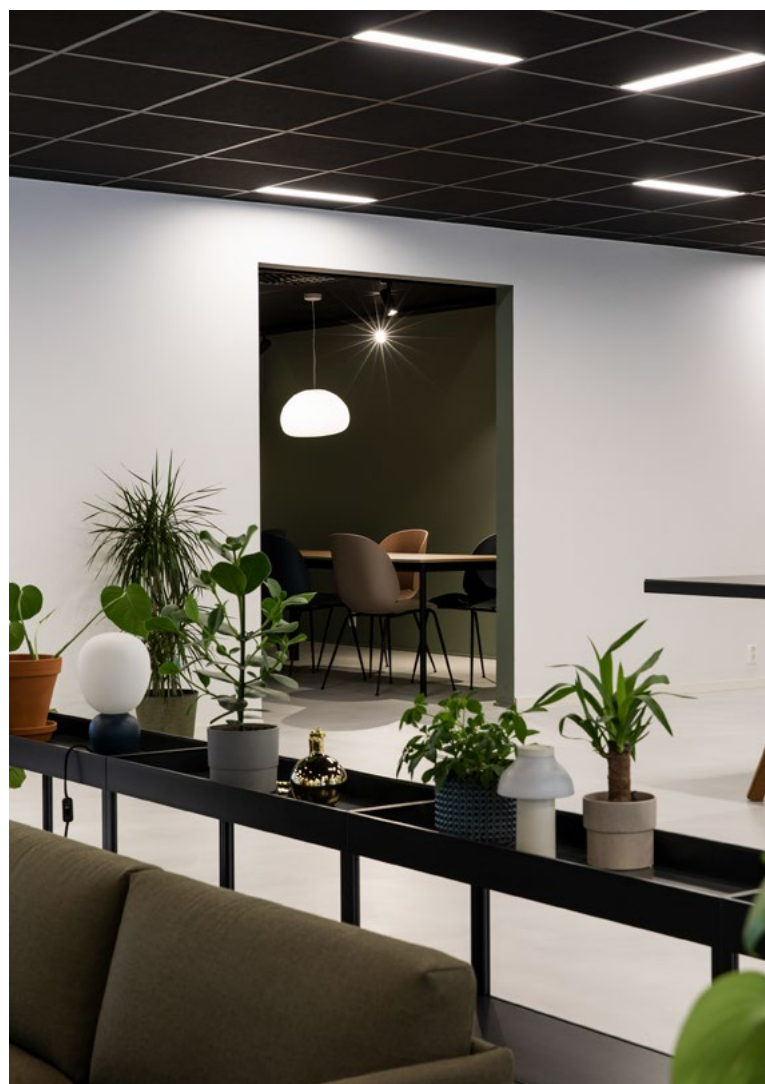
Hyllen bak sofaen i den sosiale sonen skaper skjerming mot ping pong-bordet, og gir plass til planter og dekor. Herfra er det åpent inn til spiserommet. Tidligere ble møterommet brukt som spiserom, noe som satte begrensninger for bruken av møterommet gjennom dagen. Ved å rive en vegg og flytte et lager oppnådde man større kjøkken med plass til et langt spisebord.

nevneverdig siden da – bestod derfor av mørke skipsgulv og en palett bestående nesten utelukkende av hvitt og marineblått.