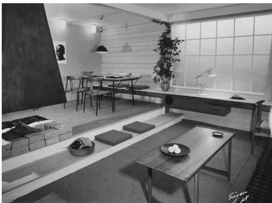
Landsforbundet Norsk Brukskunsts høstmønstring 1956