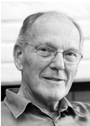
Sven Ivar Dysthe (1930–2020).