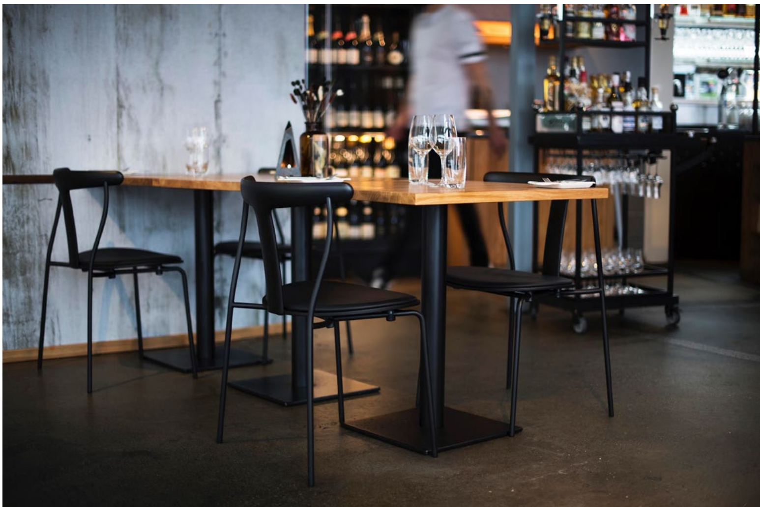
Era i utførelsen sort stål kombinert med hvitpigmentert eik og sort skinnpute. Her som en del av restauranten Fisketorget i Stavanger.