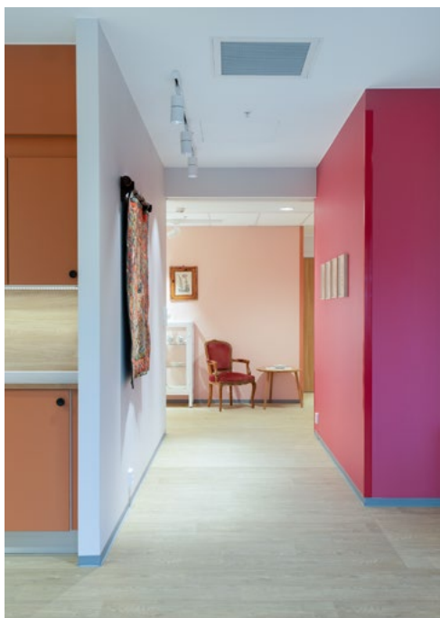
Enheten som er inspirert av dyrking har «fruktige» farger.