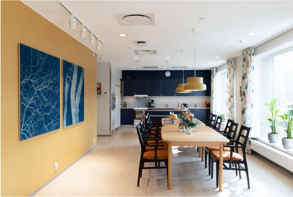
Spiseplass og kjøkken i enheten med «60-tallsikoner for voksne hippier».