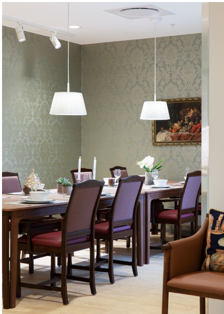
Spiseplass i den mest klassiske enheten.