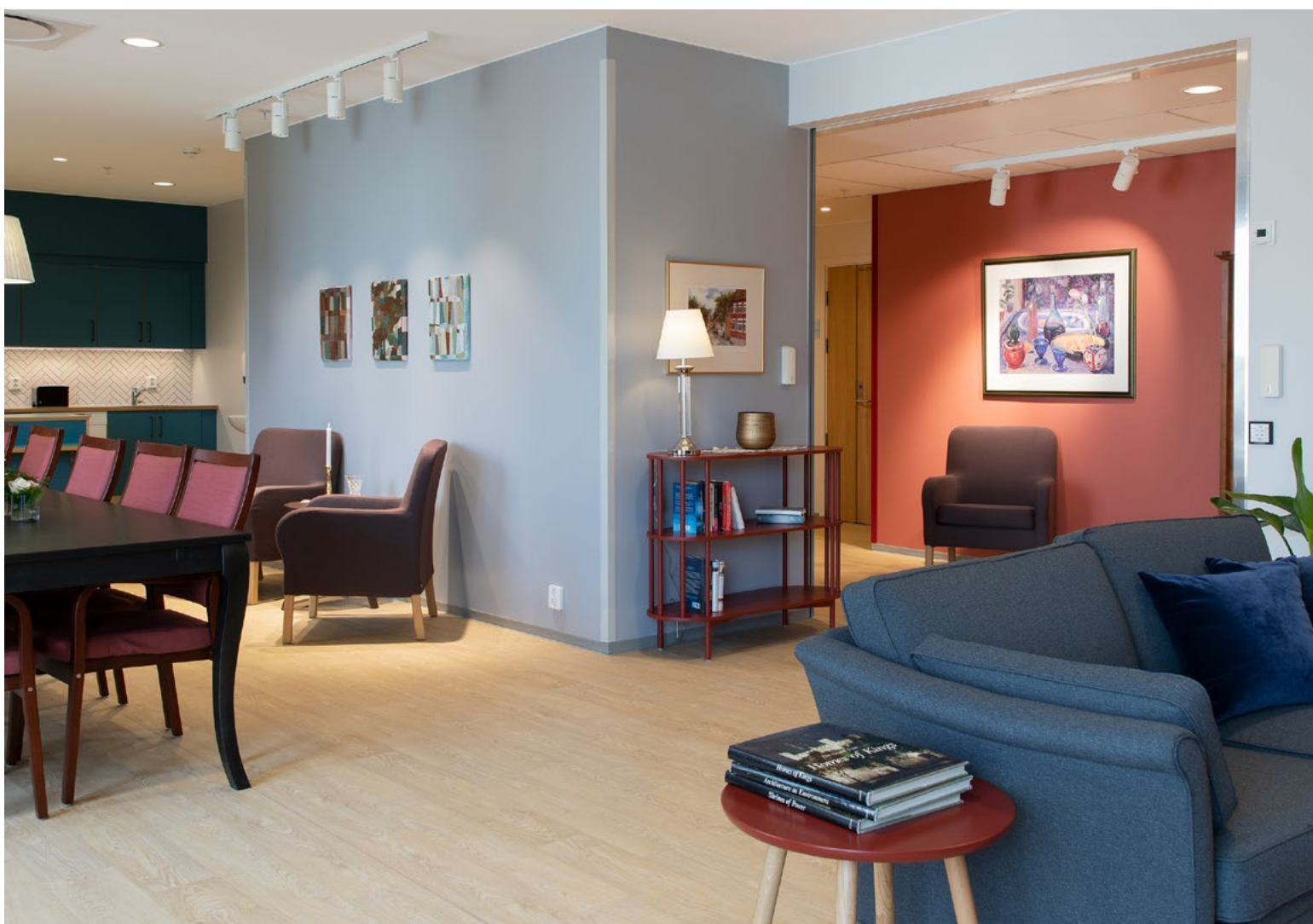
Alle enhetene har en rundgang mellom fellesrommet og korridoren som har ulike farger slik at fargene styrker romfølelsen, og som samtidig inviterer til bevegelse rundt – uten å miste orienteringen.