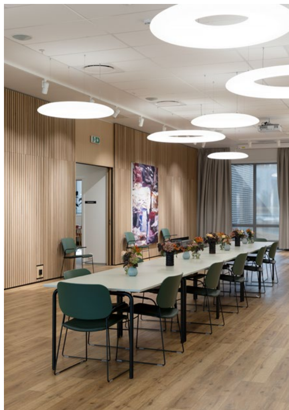
«Grendehuset» kan brukes til alt fra fellessamlinger til fest og kan også leies av nærmiljøet.