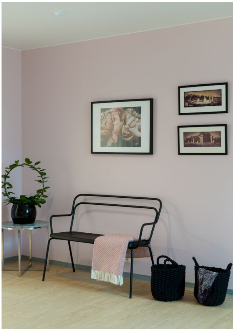
Entréen i en av de mer urbane enhetene.