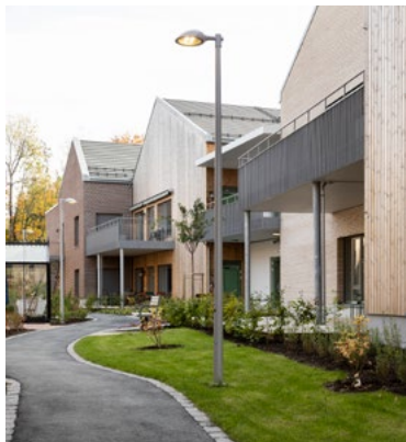
Ulike materialer i hvert hus og trygge uteområder.