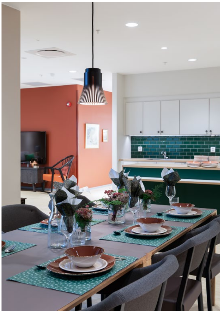
Spiseplass og fellesstue i vinkel skaper god soneinndeling i en av de mer klassisk innredete enhetene inspirert av jakt og fiske.