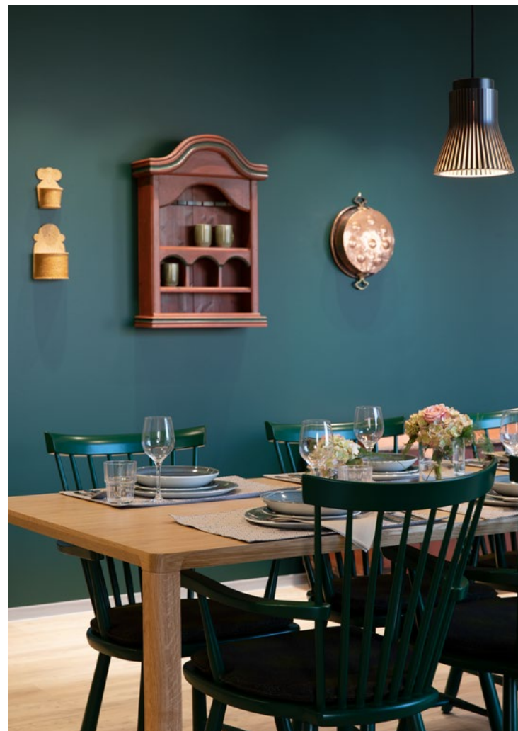
Gode minner om hytta har vært en ledetråd i konseptet for flere av enhetene. Denne fra «Hytta på fjellet».

Pleie- og omsorgsavdelingen i kommunen. Beboerenhetene ble knyttet sammen med sine tiliggende uteområder: «Hav- og sjøenheten» lå rett ved dammen, «Fjell- og skogenhetene» rett ved gapahuken, «Hage- og dyrkingsenhetene» rundt drivhuset og «Kultur- og museumsenhetene» rett ved torget osv. På denne måten ble hele anlegget også delt i mange mindre opplevelsesverdener.