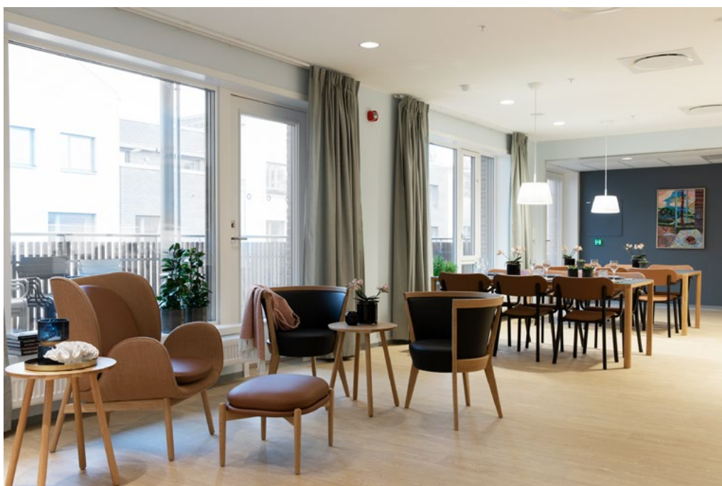
Fellesstue og spiseplass i en av de mer åpne nøytrale beboerenhetene.