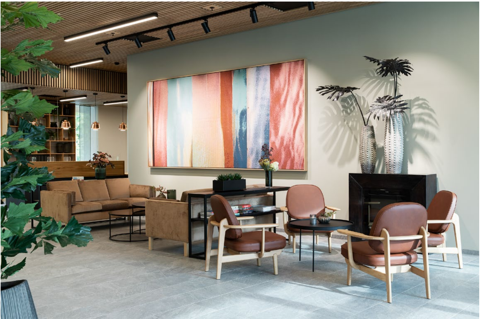
Flere møteplasser med vakker kunst i inngangssonen.