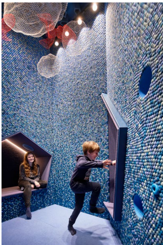
«Drømmende» er tema for barneavdelingen.

← Interiørkonseptet omfattet også prosjektering av over 60 rom med ulike atmosfærer og aktiviteter.