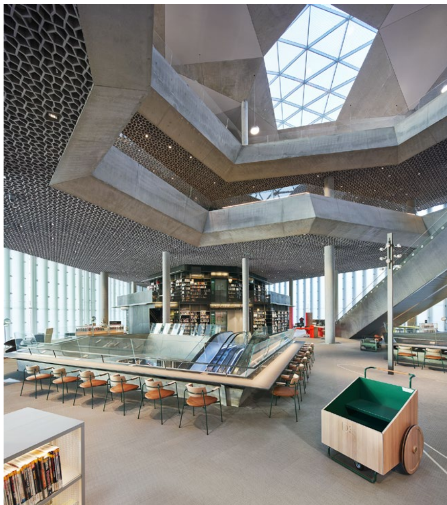
Deichmanstolen som er tegnet av Scenario, produsert i samarbeid med svenske Offecct og levert av Flokk.