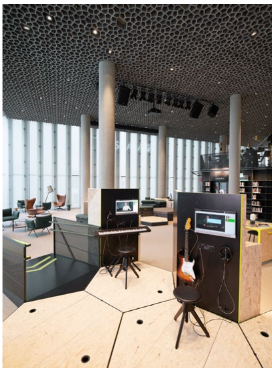
En røffere stil tilpasset ungdomslitteratur, film og musikk i 2. etasje.