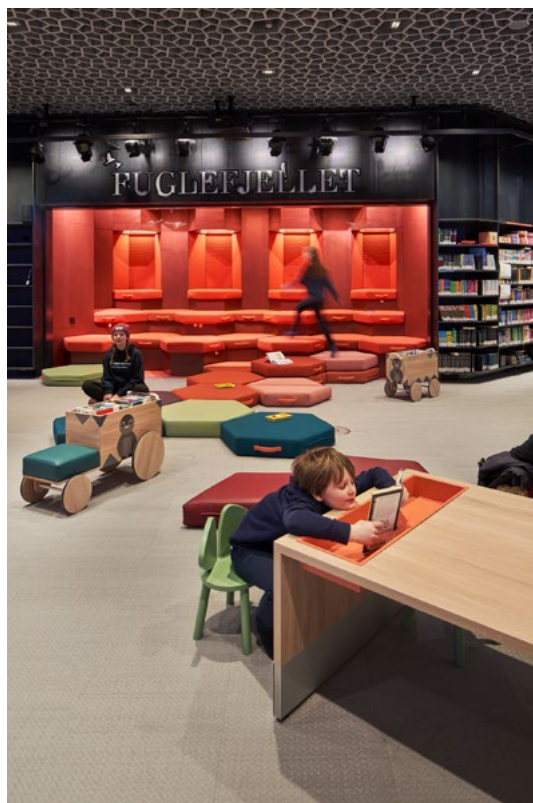
Laserkuttete mønster på treverk, geitehårstepper og linoleum i ulike farger på gulv.

← Interiørkonseptet omfattet også prosjektering av over 60 rom med ulike atmosfærer og aktiviteter.