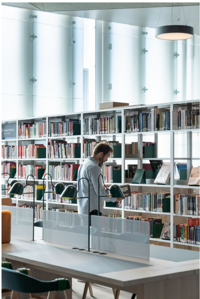
Gulvflatene ble benyttet til oppbevaring av medier.