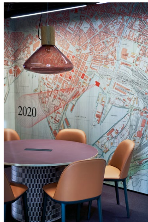
Det ble skapt ulike atmosfærer.