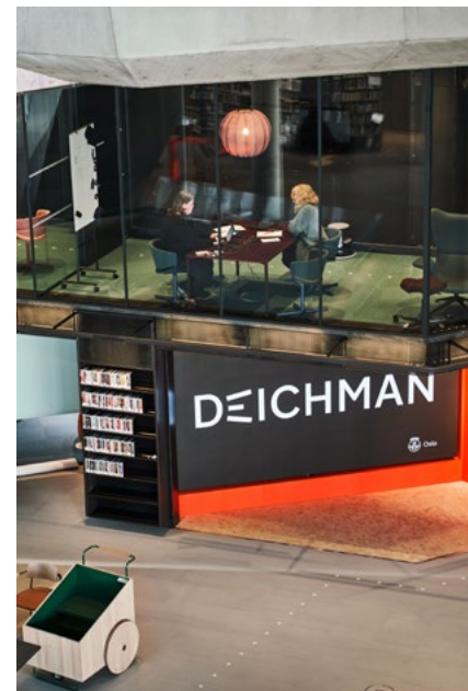
Wayfinding og skilting var en meget kompleks leveranse der man skulle skilte alt fra medier, rom, funksjoner og aktiviteter.

← Arkitekturens storslåtte dimensjoner og komplekse geometri skulle understrekes, samtidig som interiørarkitekturen skulle bidra til å gjøre arealene imøtekommende og tilgjengelige for publikum.