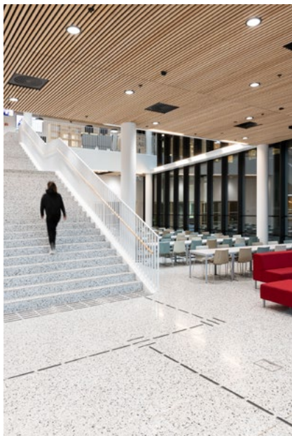
Fra hovedinngangen møter man det store atriets med trappen som binder funksjonene sammen i bygget. Oppe på plan 2 skimter man førstelinje som er resepsjonen for studenter og besøkende.