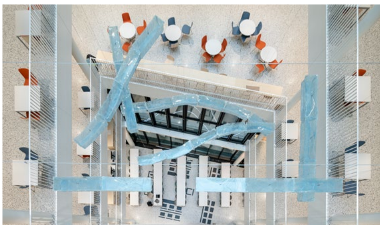
Sosiale soner, transport mellom funksjoner og kunstverkene i atriets. Queens of the Tear Duct , en skulpturell installasjon av Tiril Hasselknippe svever i atriets.