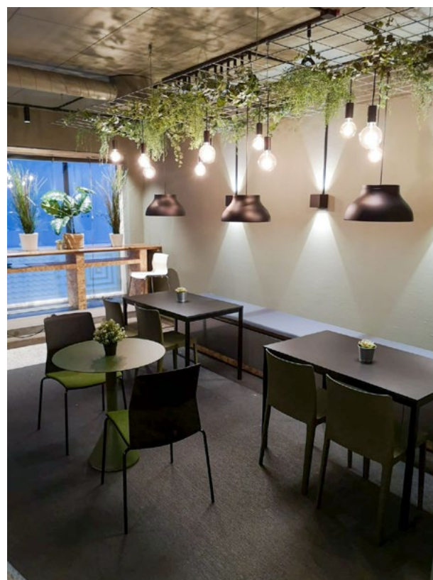
Helt fra begynnelsen har dette vært avklart som et lavkostprosjekt. Fellesverket på Grorud var slitent og trengte en real oppussing.