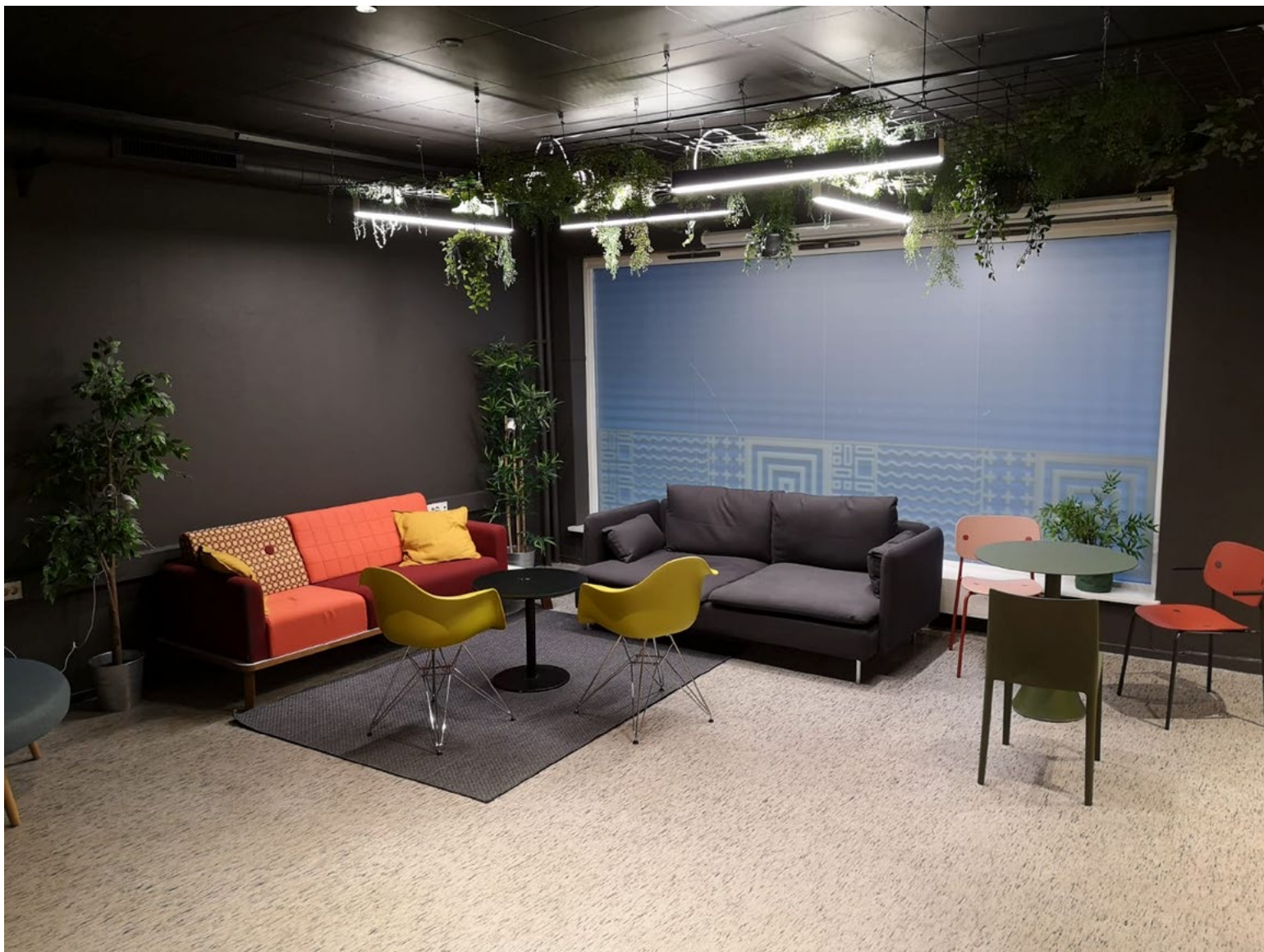
Metropolis tok kontakt med eget nettverk for sponning av møbler, lamper og maling. Det var utrolig kult å se hvor mange av deres samarbeidspartnere som ønsket å hjelpe til.

kan henge med venner, spille Fifa og slappe av uten at foreldre eller lærere skal forstyrre.