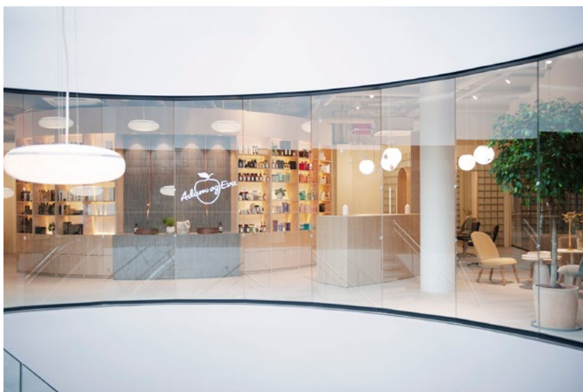
Salongen sett fra utsiden med den buede fasadeveggen.