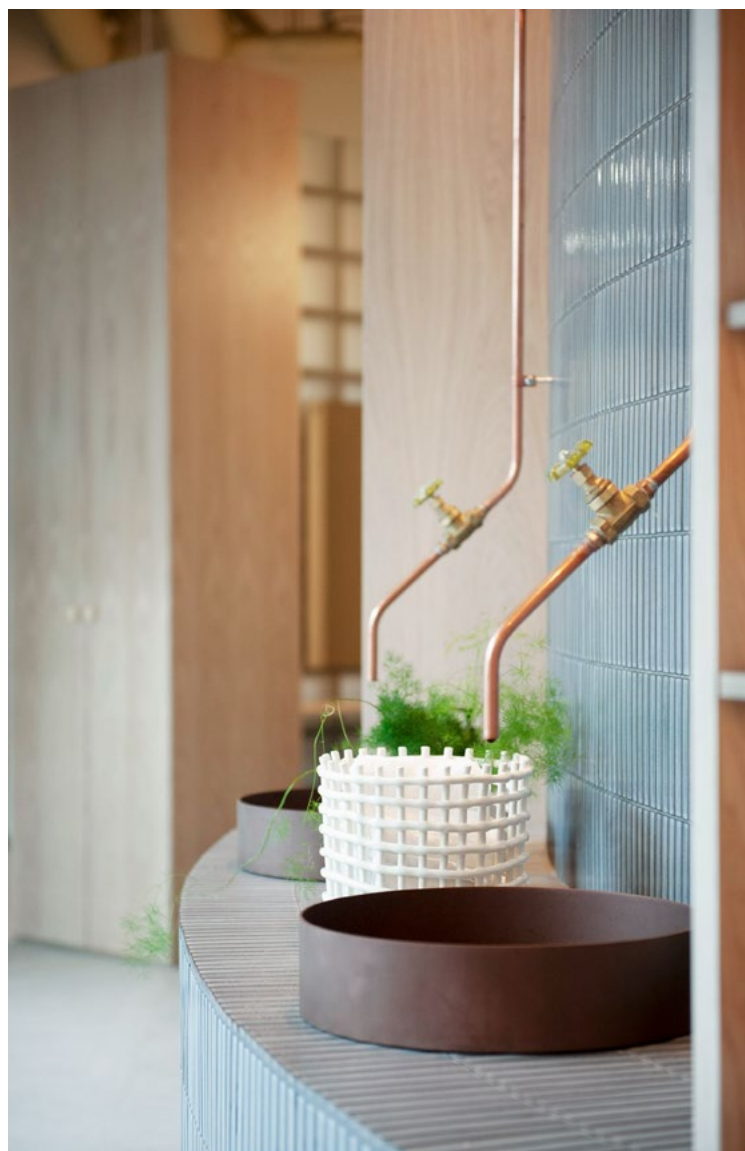
Vasken brukes aktivt for at alle kunder skal få vasket hendene sine før de setter seg ned i klippestolen. Hele vegg langs vaskene er flislagt med fingerflis, kranene ble laget på stedet av rørlegger.

hårspa og er tilgjengelig fra begge sider av salongen. Lokalet fremsto som et hvitt lerret og interiøret måtte bygges opp fra bunnen av. Bevisste valg av naturlige og varige materialer står sterkt gjennom hele salongen. Det er høy slitasje i en salong, så naturlige materialer av høy kvalitet er en nødvendighet for at salongen skal kunne «slites» med vakker patina. I tråd med oppgaven var det viktig å få på plass et estetisk gjennomført og unikt interiør, med et varig uttrykk som kunne tåle ulike trendbilder. En forankring i senterets materialbruk og arkitektoniske grep, gjør at salongen ikke er bygget på trender, men inspirert av en mer helhetlig visuell profil. Treverk i eik er, sammen med glass og stein, bærende materialer også i senterets