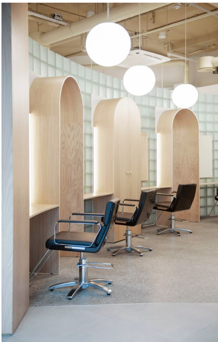
Klippeplassene er fordelt på hver side av buet glassvegg. Mellom hver klippeplass er det portaler og arbeidsskap.