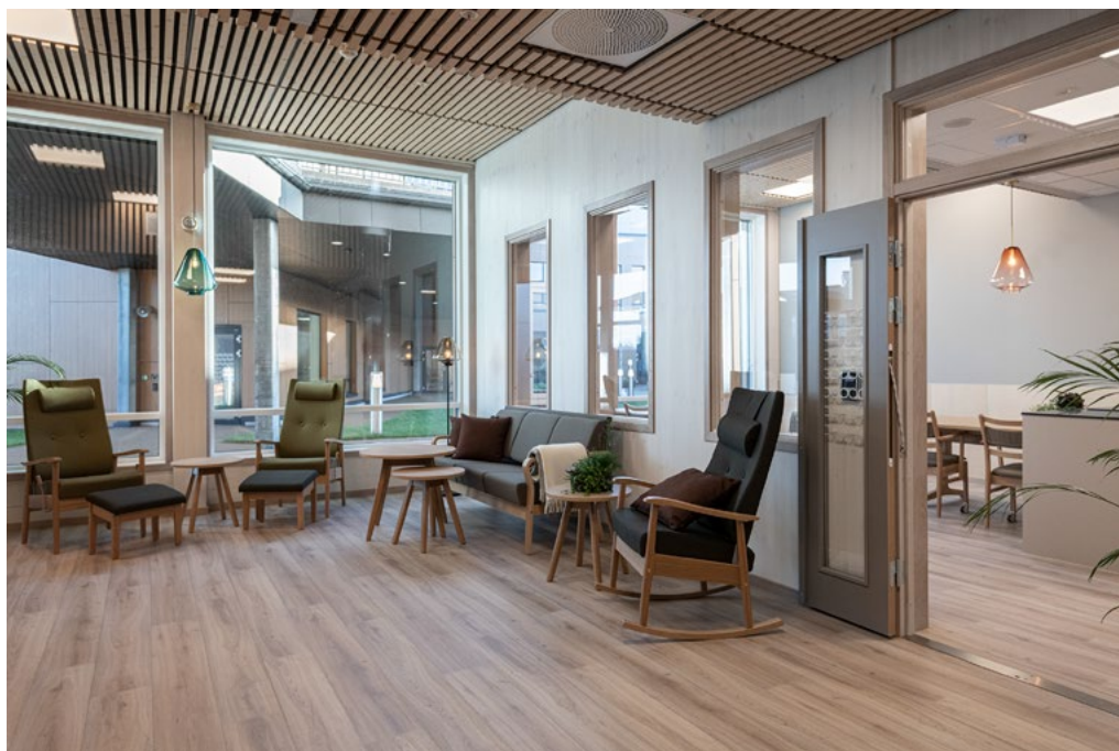
Beboerstue med kjøkkensonen i bakkant.