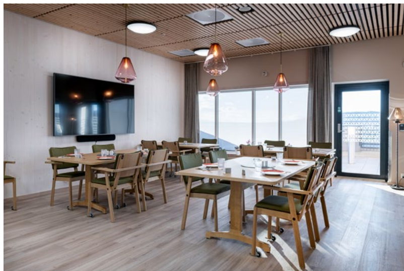
Spisearialet i Dagsenteret.