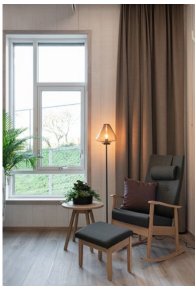
En krok å sitte, i en av beboerstuene, med spesialformet lampe for prosjektet.