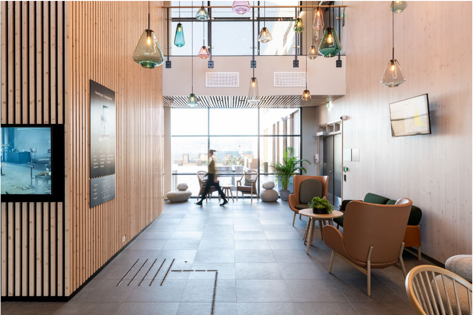
Resepsjonsarealet som knytter byggene og etasjene sammen. Den originale lampeformen pryder igjen sykehjemmet.