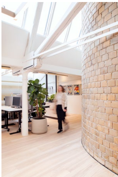
Byggets opprinnelige fabrikkpipe går tvers igjennom lokalene og det blir naturlig flyt til de forskjellige arbeidssonene.