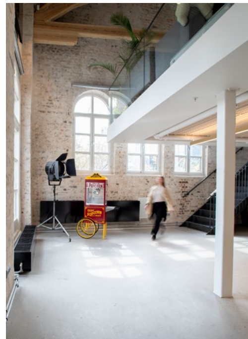
Inngangsparti og resepsjonsområde.