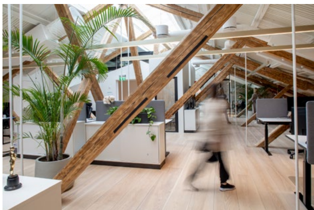
Den nye tredjeetasjen er maksimalt utnyttet i areal. Med de eksisterende overlysene er dette blitt lyse og gode arbeidsareal.