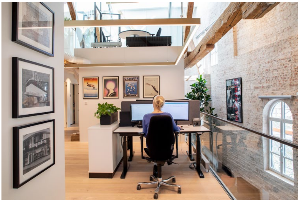
Åpne arbeidsplasser i 2. etg.