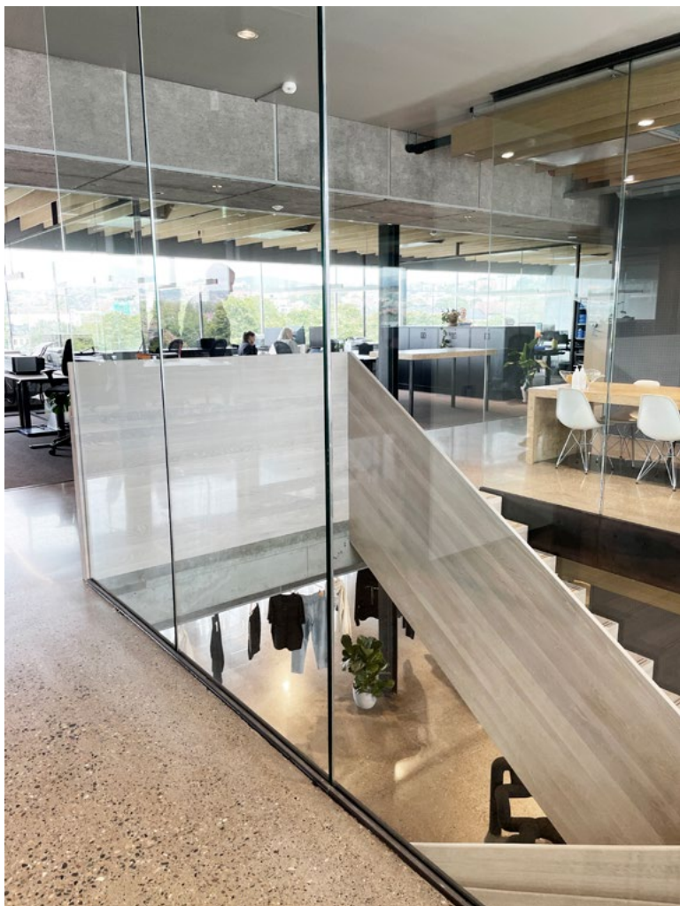
Interntrappen svever mellom etasjene og skaper visuell kontakt. Trappen er omkranset av glass og er synlig fra nesten hele lokalet.