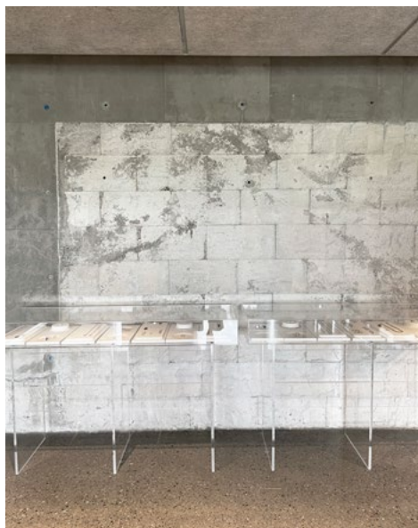
De har valgt å vise frem restene av eksisterende gjenbrukte konstruksjoner. Leietakers enkle utstillingskonsept står fint mot dette.