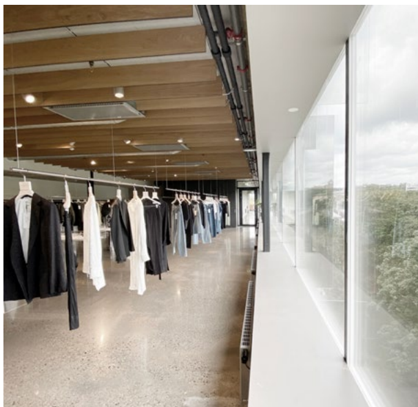
Mesteparten av 6. etg. er et åpent showroom. Utsikt mot Sofienbergparken står i fokus i det nøytrale interiøret.