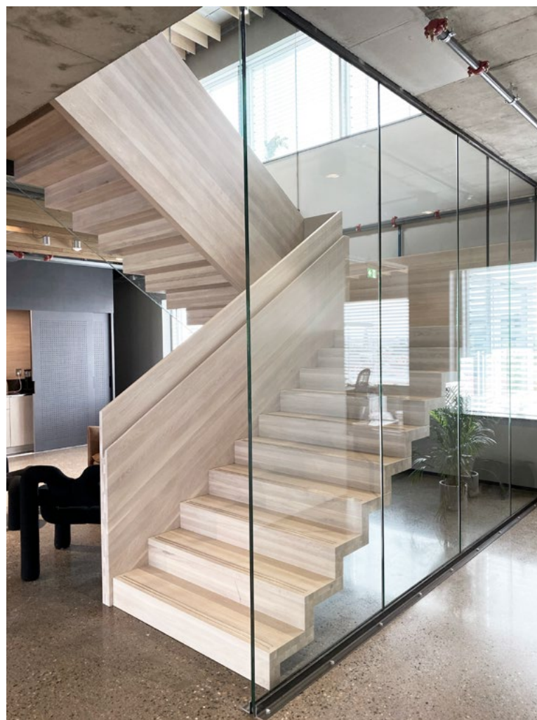
Hele trappen er i treverk; trinn, vange, repos og rekkverk. Repose er hengt opp i dekkforkanten, men ellers er konstruksjonen selvbærende. Trappens håndløper er frest ut i heltre og avrundet, og svært behagelig å ta på.

og bygger videre på materialbruken i transformasjonsprosjektet. Påbygget har en renere og mer presis estetikk sammenlignet med den røffe fabrikkbygningen, og derfor er materialene fortolket i en mer raffinert og forfinet utgave. Generelt er det brukt naturlige og enkle materialer. Det lille som var av eksisterende konstruksjoner, som opprinnelig sto på taket, er renset og eksponert. Nye brannvegger mot nabobyggene er pusset med nøytral puss. På gulvet er betongen slipt og eksponert i showroom og fellesarealer, og det er lagt teppe i kontorarealene. Kontor- og møteromsfronter er spesialbygget i råstål og glass. Fast innredning og skap er i mørk grå gjennomfarget MDF som tar opp fargen fra råstålet.