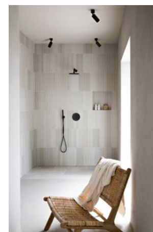
På badet glir vegger, tak og gulv over i hverandre og skaper en rolig og tilbakelemt atmosfære.

I motsatt ende av trappen ligger kjøkkenet som har fått en sentral rolle i huset og tar opp størstedelen av hovedetasjen. Her går man over på et røft og ujevnt steingulv, som gir et inntrykk av å være ute. Med dører og vindu i alle retninger, sammen med et ovalt vindu ut mot sjøsiden, skapes et luftig og dynamisk rom. Grovkjøkkenet er adskilt fra hovedrommet, med faste glassfelt fra benk til tak.