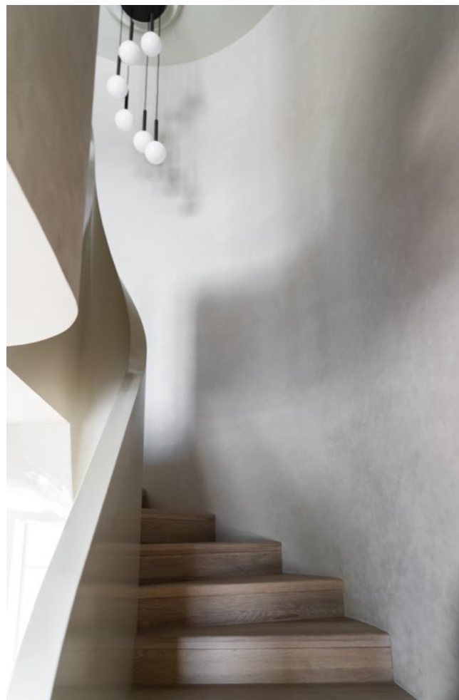
Trappen fremstår som en skulptur midt i rommet og utgjør et tydelig grep i arkitekturen. Hele formen er produsert i betong og overflaten er pusset i sandfarge.