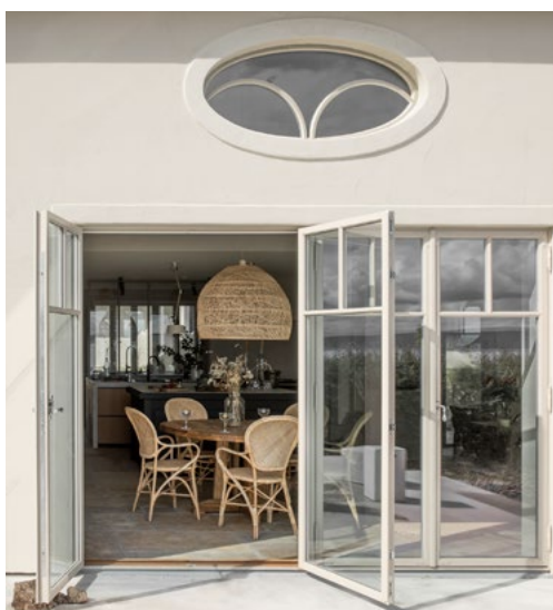
Uteområdet oppleves som en forlengelse av huset. Terrassen folder seg ut over flere nivåer.