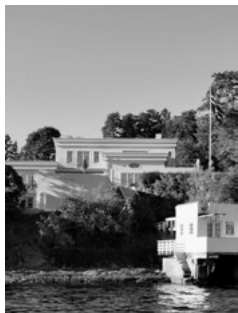
Det nybygde huset ble ferdigstilt høsten 2019. Huset er bygget med inspirasjon fra 1930-årene, og ligger ved sjøen i Asker.