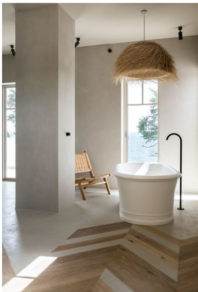
Trappen kan man følge hele veien opp til badet i toppetasjen. Soverommet er tegnet som en suite, der badet, kun adskilt med en glassvegg, er like bredt som rommet.