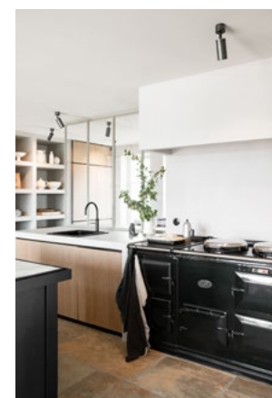
Kjøkkenet har fått en sentral rolle i huset og tar opp størstedelen av hovedetasjen.