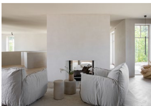
Sparklede vegger, grove steingulv, fravær av listverk og åpne rom, er med på å forme huset. Peisen er gjennomgående slik at den kan anvendes fra begge sider.