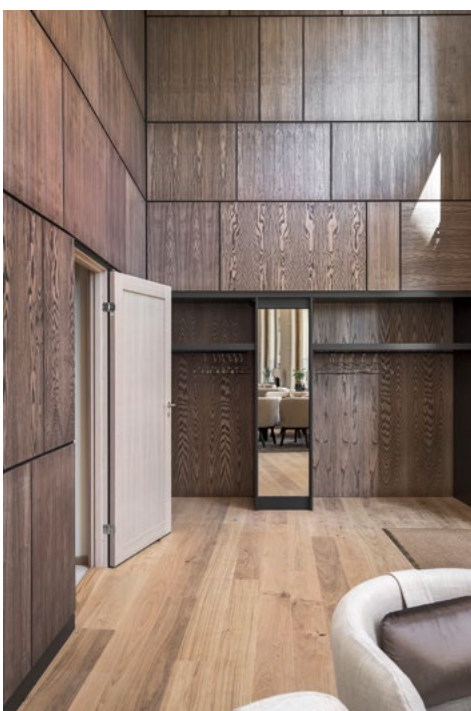
Adressatene var et voksent, urbant publikum.