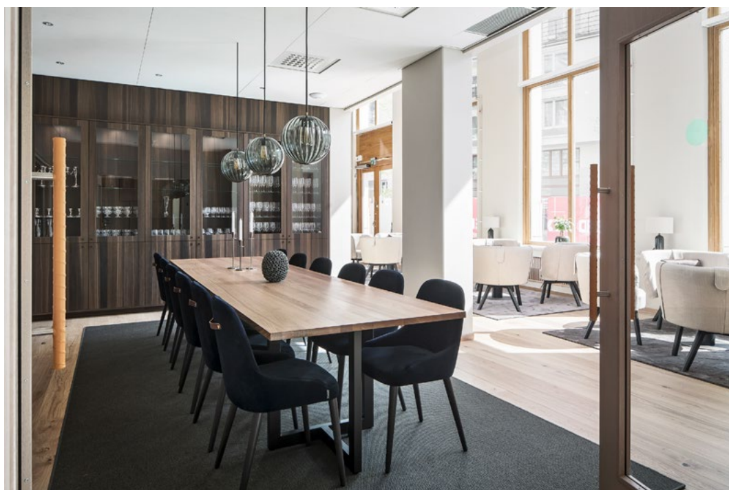
Den renskårne dimensjonen i rommene påkalte behov for elementer som kunne danne soner og gi lunhet.

det Norske plusskonseptet til å kunne imøtekomme en brukergruppe fra en nært beslektet, men allikevel særpreget kultur.