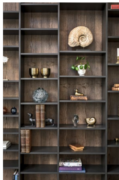
Tre, metall og stein var viktige materialer.